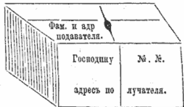
ПОСЫЛКА БЕЗЪ ЦѢНЫ.