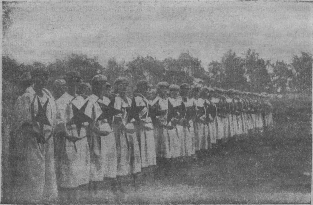
Работницы и Всеобуч.

Что работницы и крестьянки в качестве красных сестер и санитарок сумели привести много бодрости и воодушевления в свою работу, об этом говорят отчеты как воинских частей, так и медицинского персонала. Работница, красная сестра, относится к раненому красноармейцу прежде всего как к товарищу и брату, без той слащавой обходительности, с какой буржуазные сестры подходили «к бедному сол-