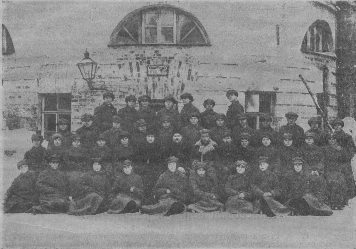
Выпуск милционерок г. Москвы.

Конечно, важно не только то, чтобы делегатские собрания собирались аккуратно и были посещаемы, важна также правильная организация, инструктирование в отделах советской работы. Нельзя допускать, чтобы вся работа сводилась к обследованию учреждений, при чем обследованию без всякого определенного плана.