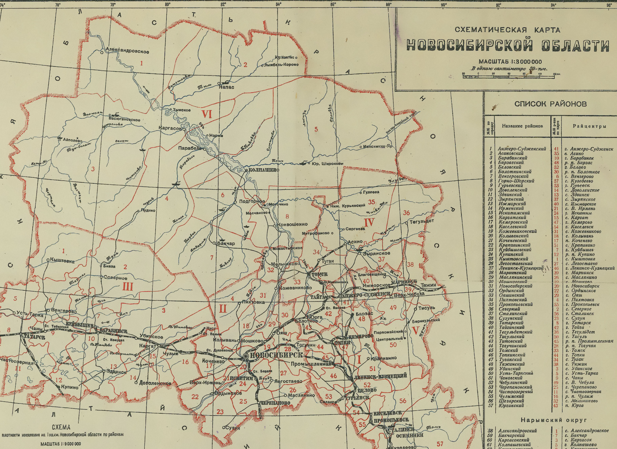
СХЕМА плотности населения на 1 кв.км. Новосибирской области по районам МАСШТАБ 1:9 000 000