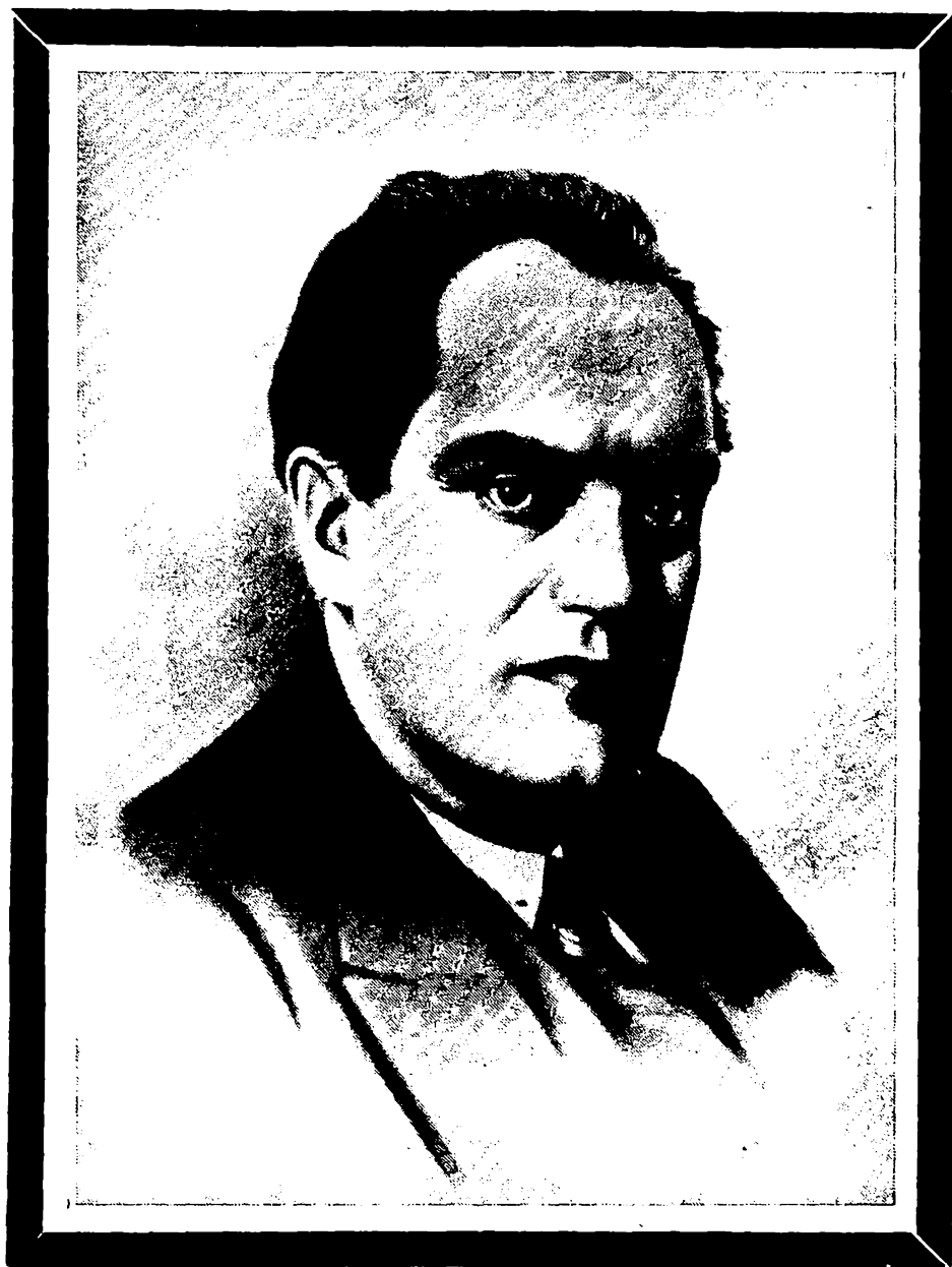
Валериан Владимирович КУЙБЫШЕВ (1888—1935)