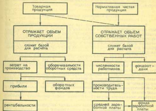
Рис. 1. Функция товарной и чистой продукции

Затраты на производство, прибыли и рентабельность определяются на основе товарной продукции, измеренной в действующих ценах. Но с применением показателя чистой продукции необходимость в показателе товарной продукции в сопоставимых ценах не отпадает. В качестве расчетного он должен быть в плане и отчете каждого предприятия и в дальнейшем по следующим причинам: