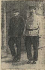
В. И. Межлаук и Ф. Э. Дзержинский. Москва, 1923 г.

Своей экономической подготовкой, умением всегда видеть общесоциалистические интересы и по-настоящему ставить их выше ведомственных