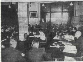
Г. М. Кржижановский выступает в Госплане СССР

Много было поездок на стройки, много отправлено таких телеграмм. Немноверные трудности строительства электростанций очень наглядно и убедительно показаны в замечательной кинокартине «Коммунизм»