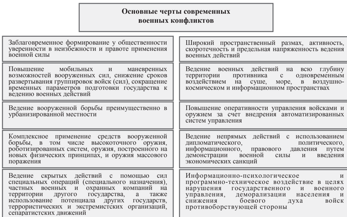
Рисунок 2. – Основные черты современных военных конфликтов

в государстве, снижения его военного и военно-экономического потенциала.