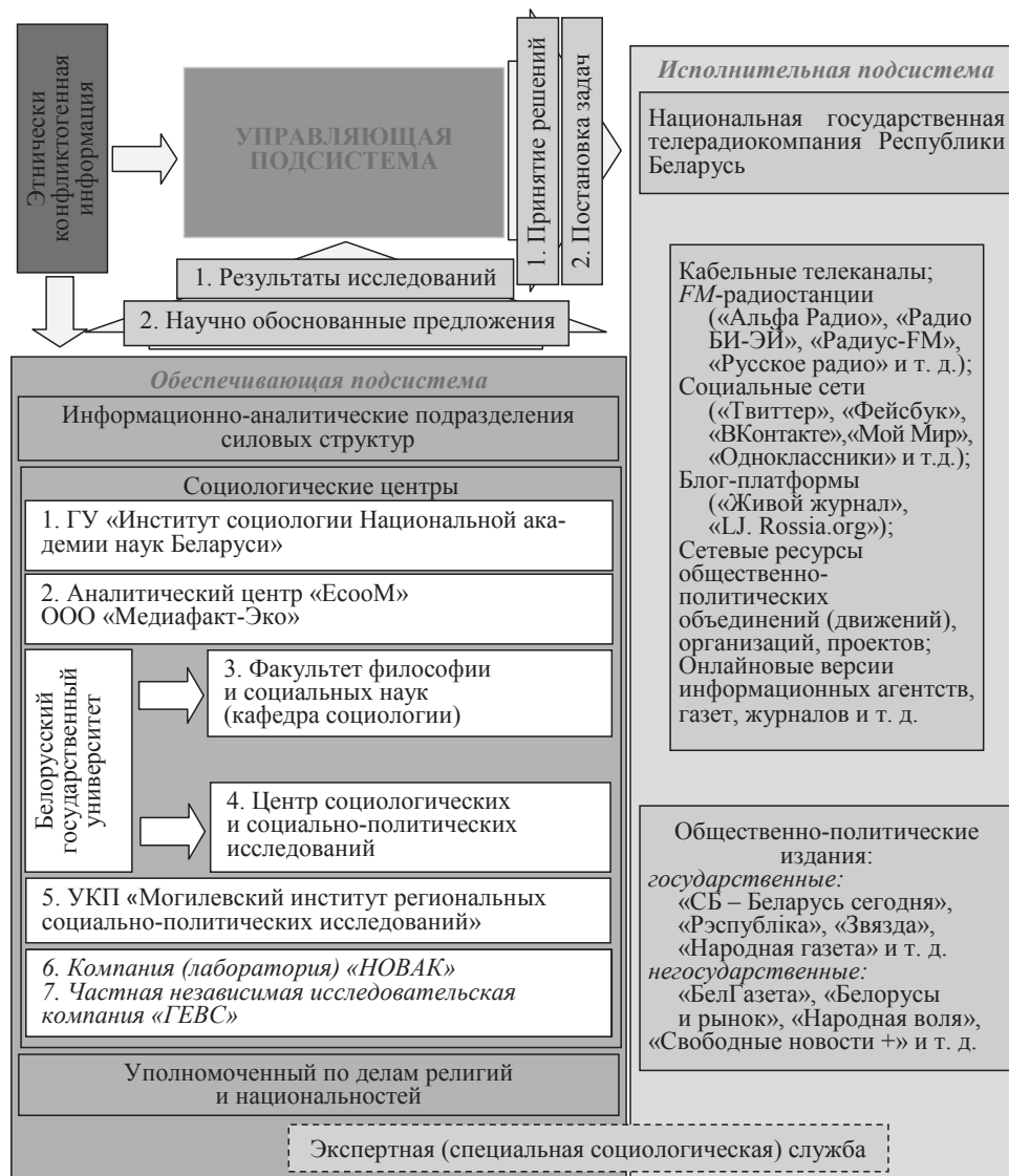
Рисунок 2. — Основные элементы подсистем системы информационного противоборства (один из вариантов)

ционного воздействия. Необходимо проработать варианты взаимодействия с FM-радиостанциями и изданиями, обладающими некоторыми чертами «желтой прессы», создать систему зеркальных сайтов для освещения межэтнических отношений, этноконфессиональной политики в Республике Беларусь, профилактики экстремизма и расизма, обеспечив их технической и информационной поддержкой. Они должны частично финансироваться из государственного бюджета, иметь дублирующие версии на зарубежных серверах, качественный дизайн, несколько языков интерфейса, удобную поисковую систему, бесплатный архив публикаций, фото- и видеоматериалов. Вышеизложенное обуславливает необходимость формирования полноценно функционирующей системы регулирования межэтнических отношений, учитывающей контекст информационного противоборства.