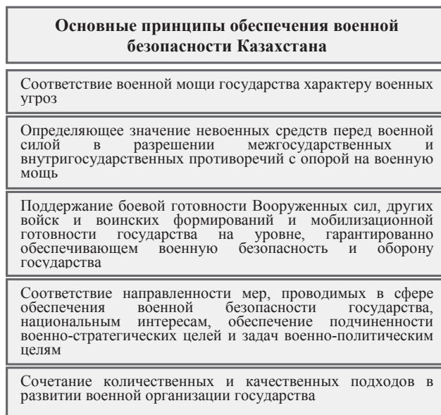
Рисунок 3. – Основные принципы обеспечения военной безопасности Казахстана

Целью деятельности в сфере обеспечения военной безопасности, отмеченной в доктрине, является повышение военного потенциала государства для адекватного реагирования на военные угрозы Казахстану. Выделены основные принципы при обеспечении военной безопасности страны (рисунок 3).