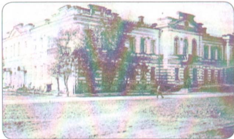
Здание Омского губернского (окружного) финансового отдела.

Вторая половина 1920-х гг.