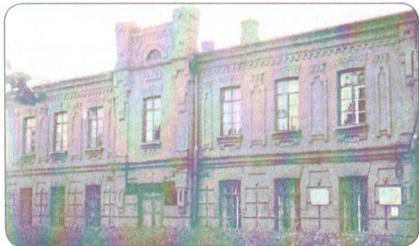
Здание штаба Омского военного округа (построено в 1915–1917 гг.). 1985 г. Из фондов Омского государственного историко-краеведческого музея The headquarters building of the Omsk military district (built 1915–1917). 1985. From the fonds of the Omsk State Museum of Local History