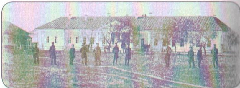
Здание Омского военно-окружного штаба (построено в 1792 г., утрачено в 1970-х гг., восстановлено в 1997 г.). Конец XIX в. The building of the Omsk Military District Staff (built in 1792, destroyed in 1970s, restored in 1997). Late 19th century.

и управляющим делами Сибирского военного совещания 16 . Сам же генерал (вероятнее, из опасений за себя) позднее везде свидетельствовал, что был призван по мобилизации и назначен на прежнюю должность представителя от Военного министерства в окружном совещании Омского военного округа, переименованном затем в Сибирское военное совещание 17 . Как указывал Николай Николаевич, в Омске в начале июля 1918 г. была объявлена всеобщая регистрация офицеров, каковым в трехдневный срок приказано было явиться к прежним местам службы и приступить к исполнению своих обязанностей 18 .