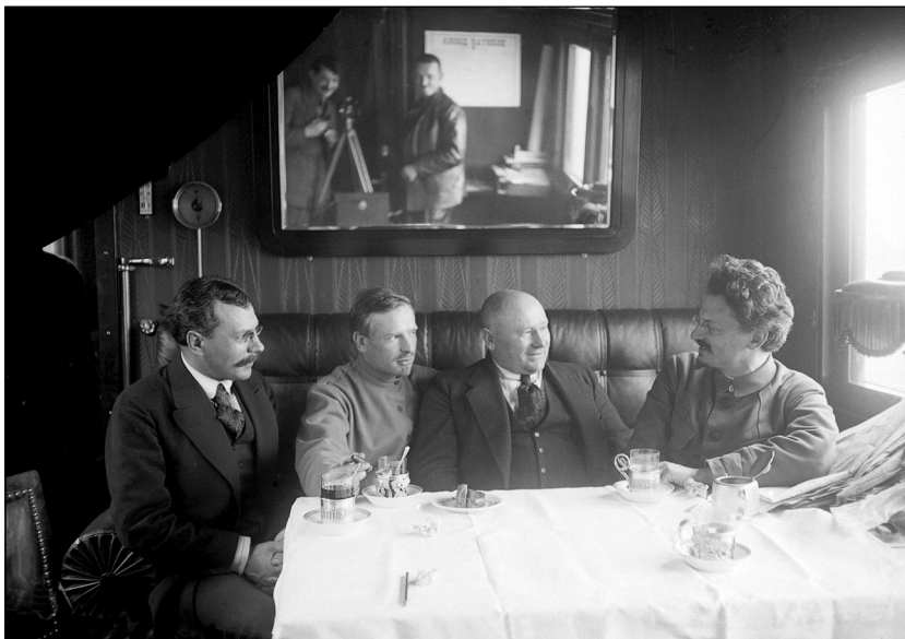
Совещание в салон-вагоне Л.Д. Троцкого. Слева направо: С.Е. Сакс, С.И. Аралов, И.И. Вацетис, Л.Д. Троцкий 1918 г.

главного начальника снабжений. Разъяснялось, что «Военный революционный совет отнюдь не считает нужным подчинение себе географической территории, но находит совершенно необходимым подчинение ему всех войск и новых формирований, расположенных и располагаемых на территории Екатеринбургской, Уфимской, Пермской, Вятской, Казанской, Нижегородской, Симбирской, Пензенской, Саратовской, Оренбургской губерний и Уральской области.