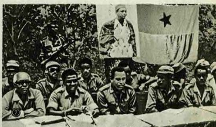
Т А Б Л И Ц А VII. 1. Всемирный конгресс миролюбивых сил. Москва, 25—31 октября. 2. Открытие X Всемирного фестиваля молодежи и студентов. Берлин, 28 июля. 3. Открытие переговоров о взаимном сокращении вооруженных сил и вооружений в Центр. Европе. Вена, 30 октября. 4. ГДР. Первый энергоблок атомной электростанции «Бруно Лойшнер», сооружаемой с помощью СССР (вступил в строй в декабре). 5. САР. Перекрытие русла р. Евфрат на сооружаемом с помощью СССР гидроэнергетическом комплексе. 5 июля. 6. Строительство газопровода СССР—Финляндия (завершено в конце 1973 г.). 7. Президиум 1-й сессии Национального народного собрания Гвинеи-Бисау, провозгласившего независимость этой республики. Сентябрь.