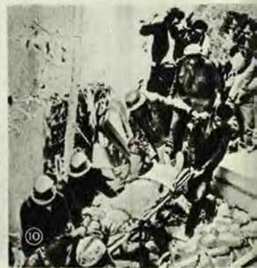
ТАБЛИЦА VIII. 1. Великобритания. Демонстрация с требованиями о прекращении роста цен на продукты питания и товары первой необходимости. Лондон, март. 2. Италия. Антифашистская демонстрация в Риме. Весна 1973 г. 3. США. Индейцы охраняют церковь, в которой проходит митинг борцов за равноправие американских индейцев. Пос. Вундел-Ни, Юж. Дакота, март. 4. Португальские каратели допрашивают мозамбикского крестьянина. Лето 1973 г. 5. Чили. Солдаты военной хунты, захватившей власть 11 сентября 1973 г., на одной из улиц Сантьяго. 6. Дания. Массовая демонстрация рабочих в знак протеста против действий владельцев международного треста «Хоуп компьютер корпорейшн». Август. 7. Юж. Корея. Разгон молодежной демонстрации в Сеуле. Октябрь. 8. Израильский танк, подбитый египтянами. Синайский п-ов, октябрь. 9. Командующий чрезвычайными силами ООН на Вл. Востоке генерал Э. Сийласвуо беседует с военными служащими польского контингента чрезвычайных сил. Синайский п-ов декабрь. 10. САР. Жертвы налета израильской авиации. Дамаск, октябрь.