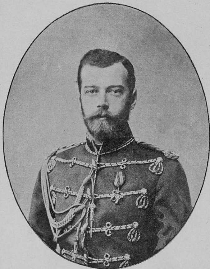
ВТО ИМПЕРАТОРСКОЕ ВЛИЧЕСТВО ГОСУДАРЬ ИМПЕРАТОРЪ НИКОЛАЙ АЛЕКСАНДРОВИЧЪ.