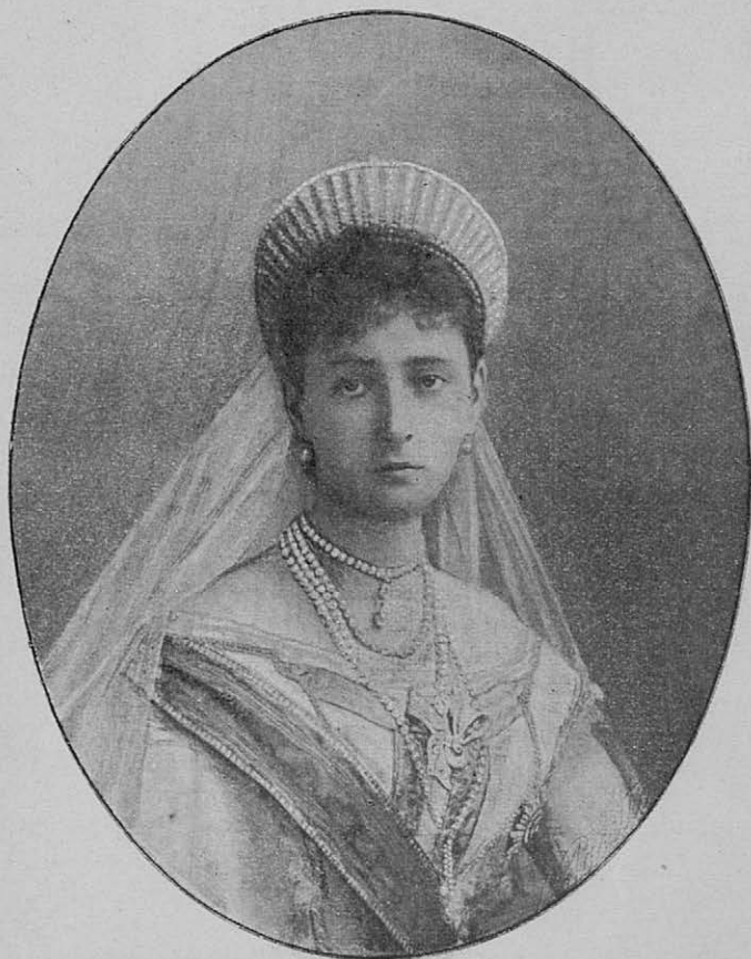
ВЪ ИМПЕРАТОРСКОЕ ВЪЛИЧЕСТВО ГОСУДАРЫНЪ ИМПЕРАТРИЦА АЛЕКСАНДРА ФЕОДОРОВНА.