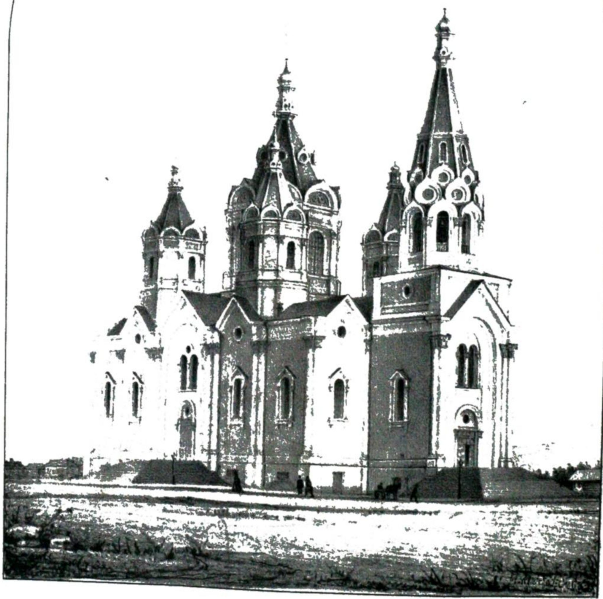
КАТЕДРАЛЬНЫЙ СОБОРЪ ВЪ Г. КРАСНОЯРСКѢ