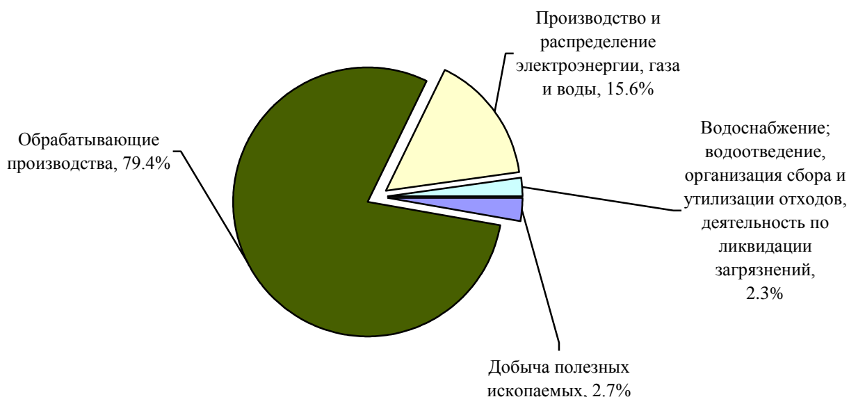
РИС. 1. СТРУКТУРА ОТГРУЖЕННЫХ ТОВАРОВ СОБСТВЕННОГО ПРОИЗВОДСТВА, ВЫПОЛНЕННЫХ РАБОТ И УСЛУГ В 2017 ГОДУ