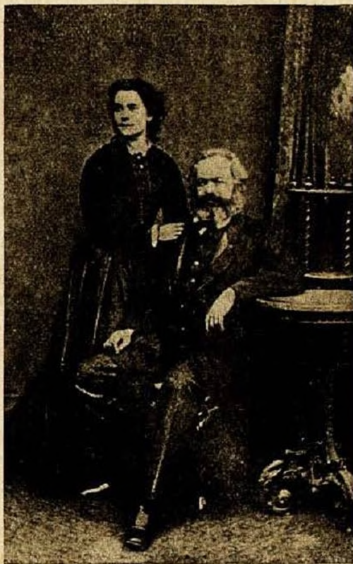
К. Маркс с дочерью

В 1864 г. в Лондон приехала небольшая делегация французских рабочих. Был устроен митинг с целью завязать связи между английскими и французскими рабочими. Это собрание не ограничилось разговорами о желательности создания международной организации рабочих. Оно выбрало комитет, которому было поручено выработать программу и устав нового международного объединения рабочих. В первоначально выбранный комитет входили, главным образом, английские рабочие — деятели профессионального движения. Этот коми-