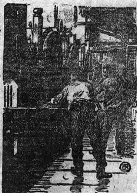
Штрейкбрехеры в машинном отделении угольных копей Цэнльберн пытаются ржуть в работу насос.