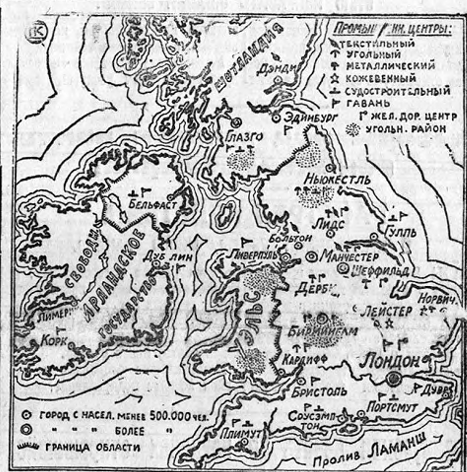
Политико-хозяйственная карта Великобритании (Англии, Шотландии; Ирландии и Уэльса).

ЛОНДОН, 8 июня. Шахтовладельцы проявляли значительное беспокойство. С начала забастовки углекопов фирмы, вывозящие уголь, не довезли уже 8 миллионов тонн угля (тонна 61 пуд). К этой цифре необходимо прибавить сокращение употребления угля внутри страны.