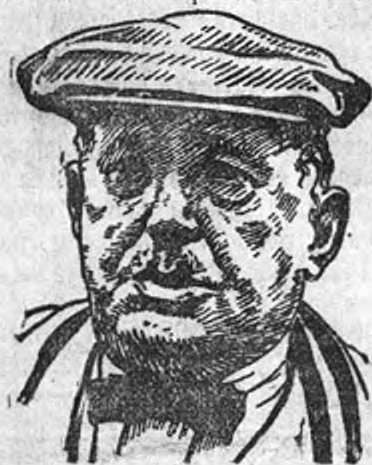
СМИТ, председатель федерации английских горняков.

чел., т.-е. на 17.701 чел. меньше чем в пятницу, 15 октября. По отдельным районам положение представляется в следующем виде: в Ноттингемшире и Дербишире количество работающих горняков с 15 октября сократилось на 11.557 чел., в Ланкашире—на 6.472 чел., в Дареме, Шотландии, Йоркшире и Южном Уэльсе отмечено незначительное увеличение количества вышедших на работу углекопов. 19 октября, впервые за все время угольной забастовки, в Англии имело место резкое похолодание. Понижение температуры неизбежно вызовет увеличение спроса на уголь, но в то же время обострит тяжелое положение бастующих горняков, и, возможно вызовет увеличение заболеваний и смертности среди них и их семей.