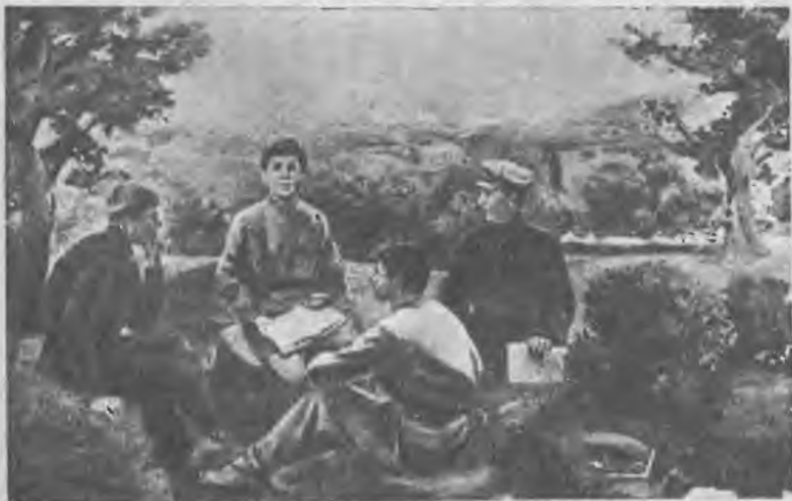
В мае 1894 г. товарищ Сталин окончил духовное училище и в том же году поступил в Тифлисскую духовную семинарию.