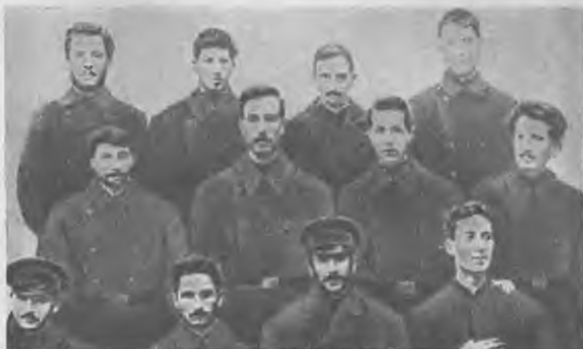
Вот товарищ Сталин (второй в верхнем ряду) среди своих соучеников по семинарии.

...Тяжелый был режим в этом училище. Нельзя было почитать газету, пойти в театр. После пяти часов вечера запрещалось выходить на улицу. Бесконечные моления: перед уроком, перед завтраком, перед обедом, перед сном. За учащимися была установлена слежка преподавателей.