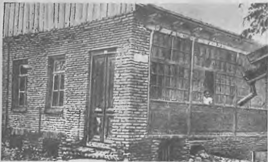
В этом домике провел он свое детство.

Шестьдесят лет назад, 21 декабря 1879 г., в грузинском городке Гори, в семье сапожника, рабочего обувной фабрики, Виссариона Джугашвили родился Иосиф Виссарионович Сталин.