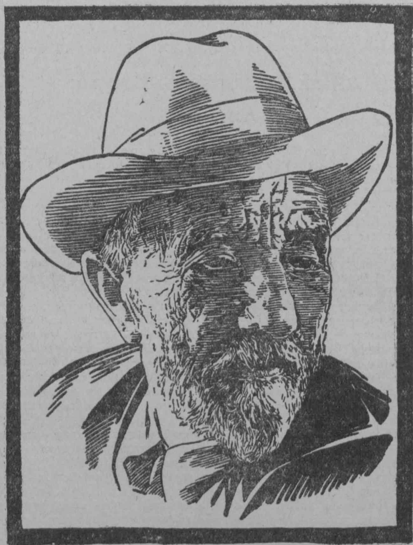
ИВАН ВЛАДИМИРОВИЧ МИЧУРИН (1854—1935)