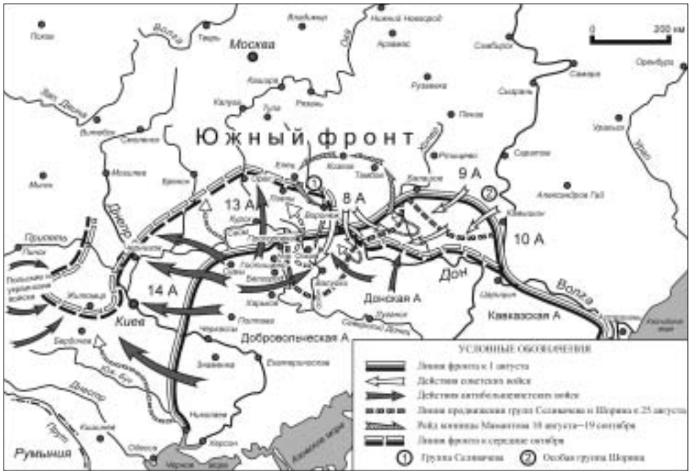
Южный фронт РСФСР в августе — октябре 1919 г.

ская война и военная интервенция в СССР», у Селивачёва было 49,7 тысячи штыков и 4,7 тысячи сабель, 268 орудий, 1 381 пулемет 123 . Однако перерасчет по данным о боевом составе дивизий и бригад группы на 15 августа 1919 г. дает гораздо меньшую численность — 40 066 штыков, 4 153 сабли, 235 орудий и 1 236 пулеметов 124 на фронте в 410 км.