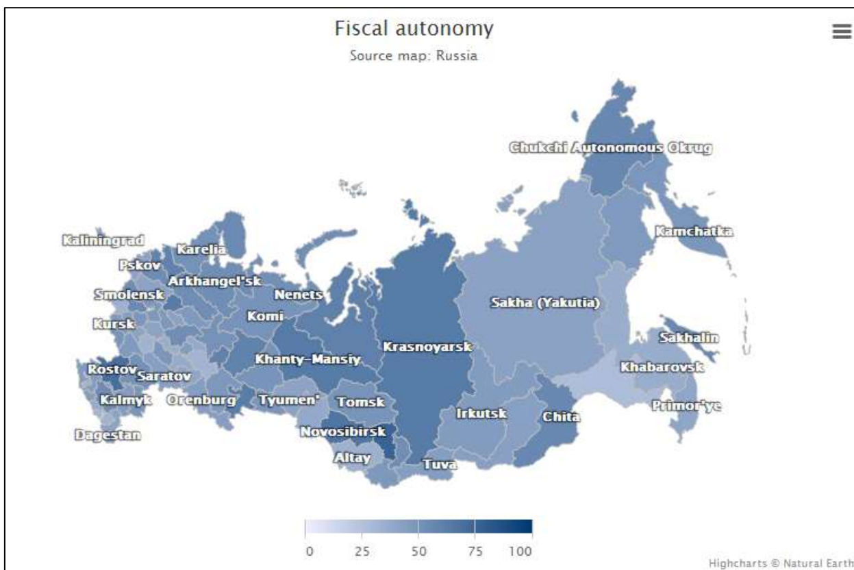
Рисунок 3 – Анализ бюджетной самостоятельности субъектов РФ

Примечание: Интерактивная версия доступна http://jsfiddle.net/9wtg08w9/1/embedded/result/