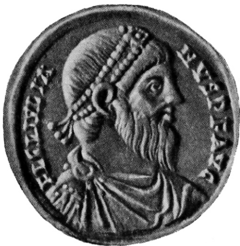
Золотая медаль с изображением Юлиана. IV век нашей эры. Венский музей.

тем не менее, сумел существенным образом изменить режим предоставленных ему провинций. Прежде всего при нем радикально уменьшилось налоговое бремя населения. По свидетельству Аммиана Марцеллина, он сократил в Галлии поземельную подать с двадцати пяти золотых с облагаемой единицы до семи 1 . Вместе с тем Юлиан запретил несправедливые льготы (индальгенции) богатым лицам при распределении налогов, взяв под свою специальную защиту интересы низших категорий плательщиков.