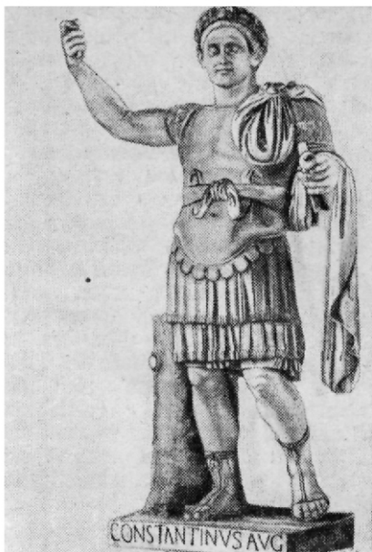
Константин. Статуя в портике Латеранской базилики в Риме.

Зародившись впервые как «религия рабов и вольноотпущенных, бедняков и бесправных, покоренных или рассеянных Римом народов» 2 , христианство было использовано идеологами господствующих классов для отвлечения масс от революционной борьбы и воспитания их в духе