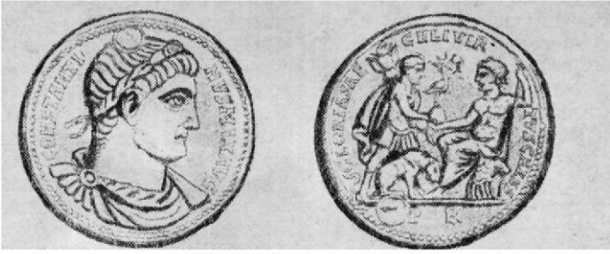
Бронзовая медаль с изображением Константина. IV век нашей эры.

имел чрезвычайно вредные последствия для благосостояния империи. Упадок городских курий во второй половине IV века стал совершенно катастрофическим. В соответствии с уменьшением числа куриалов увеличивался тяготевший над ними фискальный гнет. Речи Либания: «О патронах», «К антиохийскому селату» и «К императору о куриях» 1 — свидетельствуют о полном развале муниципального самоуправления. По словам Либания, в антиохийской курии до Константина было шестьсот членов, а через несколько десятилетий после него не осталось и шестидесяти.