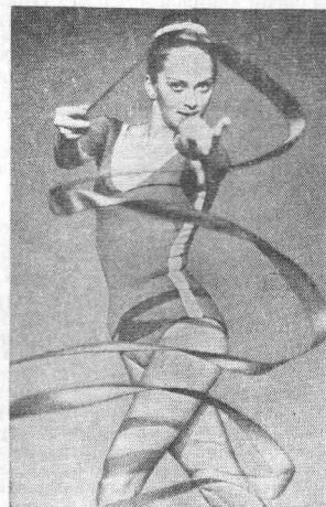
Чемпионка мира 1977 г. по художественной гимнастике И. Дерюгина (СССР).

Спортсмены под №№ 4, 5 и 7 — призеры чемпионата Европы.