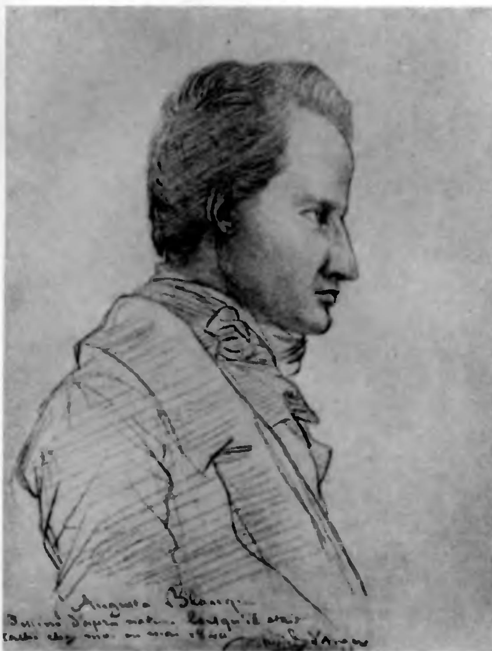
Карандашный портрет Бланки работы Давида д'Анжера (1840)