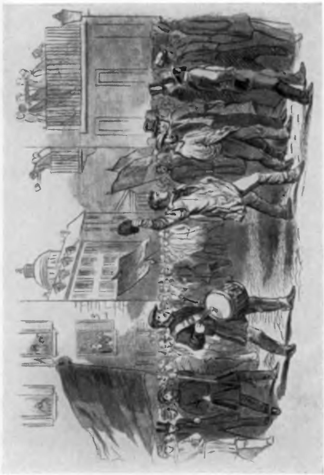
Манифестация 17 марта 1848 г. за отсрочку выборов .