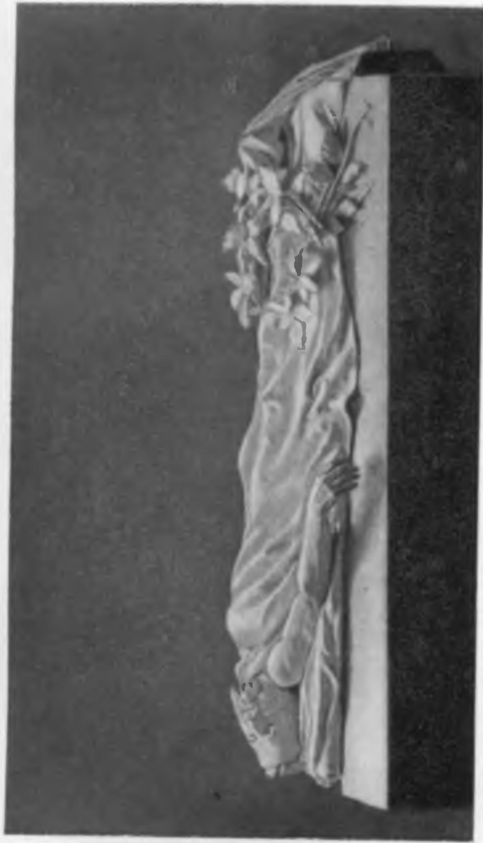
Памятник на могиле Бланки работы Далу