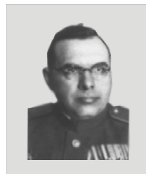
Рис. 3. П.П. Кондаков