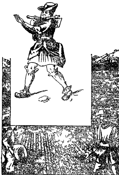
Французские крестьяне XVI в С миниатюры

ков» не умерла во Франции В 1320 году произошло второе восстание «папушников» в сходной обстановке Снова толпы крестьян (по летописи, их было около 40 тысяч) двинулись к южнофранцузским портам в крестовый поход, разрушая по дороге усадьбы помещиков Граф де Фуа напал на них и рассеял крестьянское ополчение Много крестьян было убито, много перевешано Это было прелюдией к огромной крестьянской войне 1358 года