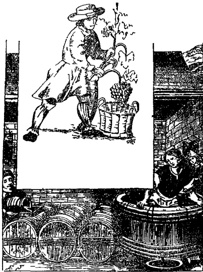
Французские виноградари XVI в. С миниатюры

Между тем конфликт между правительством регента и парижской буржуазией все более обострялся. Дофин собрал значительное войско феодалов и занял все важнейшие пункты в Ильде-Франсе, стараясь окружить мятежный Париж и изолировать его от остальной Франции. В его намерение входило взять столицу голодной блокадой. Дворянские банды стягивались в лагерь дофина, разоряя и грабя по дороге крестьянство. Правительство накладывало на крестьян повинности, связанные с постройкой и ремонтом укреплений, предназначенных для блокирования Парижа. Терпению крестьян приходил конец.