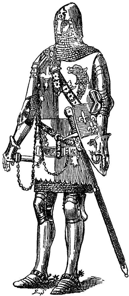
Французский рыцарь. XIV в.

торого был Карл Наваррский, не желал допустить выступления парижского отряда против своего союзника. Другим мотивом его политики являлось то обстоятельство, что в крепости Мо под охраной слабого отряда затерлось много жен и детей французских дворян, там даже находились жена и сестра регента. Захватив их в плен, Этьен Марсель рассчитывал получить важные преимущества в своей борьбе с дофином.