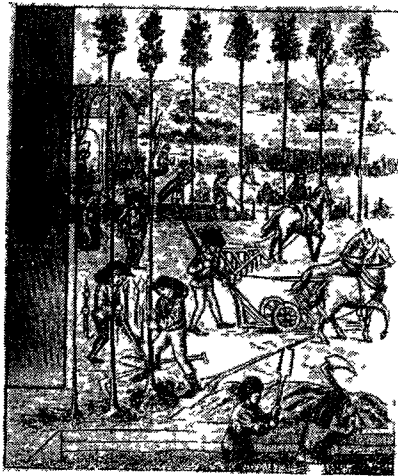
Сельские работы во Франции XI в. По миниатюре того времени

дены были предостерегать от идеализации этого процесса «Освобождение, — как указывал Анри Сэ, — все не ликвидировало помещичьей эксплуатации крестьянства» 1