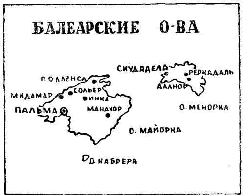
Схема Баlearских островов.