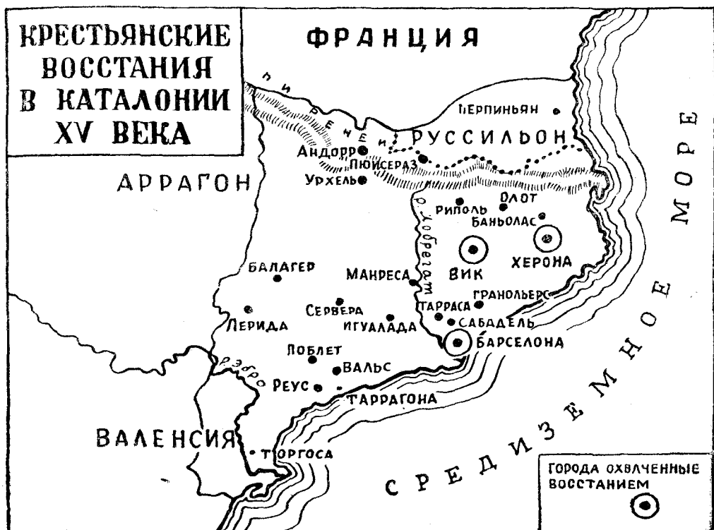
Схема крестьянских восстаний в Каталонии в XV веке.

Недостаток продовольствия заставил крестьян временно снять осаду Безалю. Повстанцы взяли штурмом соседний замок, Кастьеллолит, владелице которого, помещице Беатрисе де