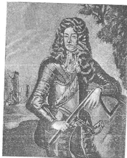
Иаков II. Гравюра Смита по портрету Кноллера.

В 1685 году Карл II умер, и вступивший на престол его брат Иаков II продолжал с еще большей активностью ту же политику. Ограниченный деспот, ханжа, жестокий и развратный лицемер, Иаков II восстановил против себя почти все слои английского народа и довел страну до взрыва, который лишил его власти и заставил уйти в изгнание. «У него не было правильного суждения, — рассказывал современник, — его скоро молли настроить на свой лад те, кому он доверял, но зато он упорно противостоял всем другим советам. Он был воспитан в правилах самого высокого представления о королевской власти и считал непреложной исти-