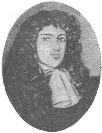
Граф Арчибалд Аргайль. С картины Флатмана.

ной, что все, кто противоречит ему, мысленно являются мятежниками» 1 .