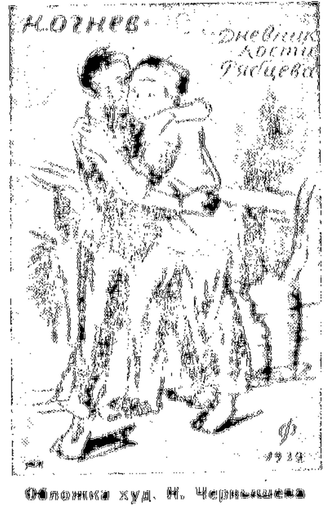
Обложка худ. Н. Чернышова