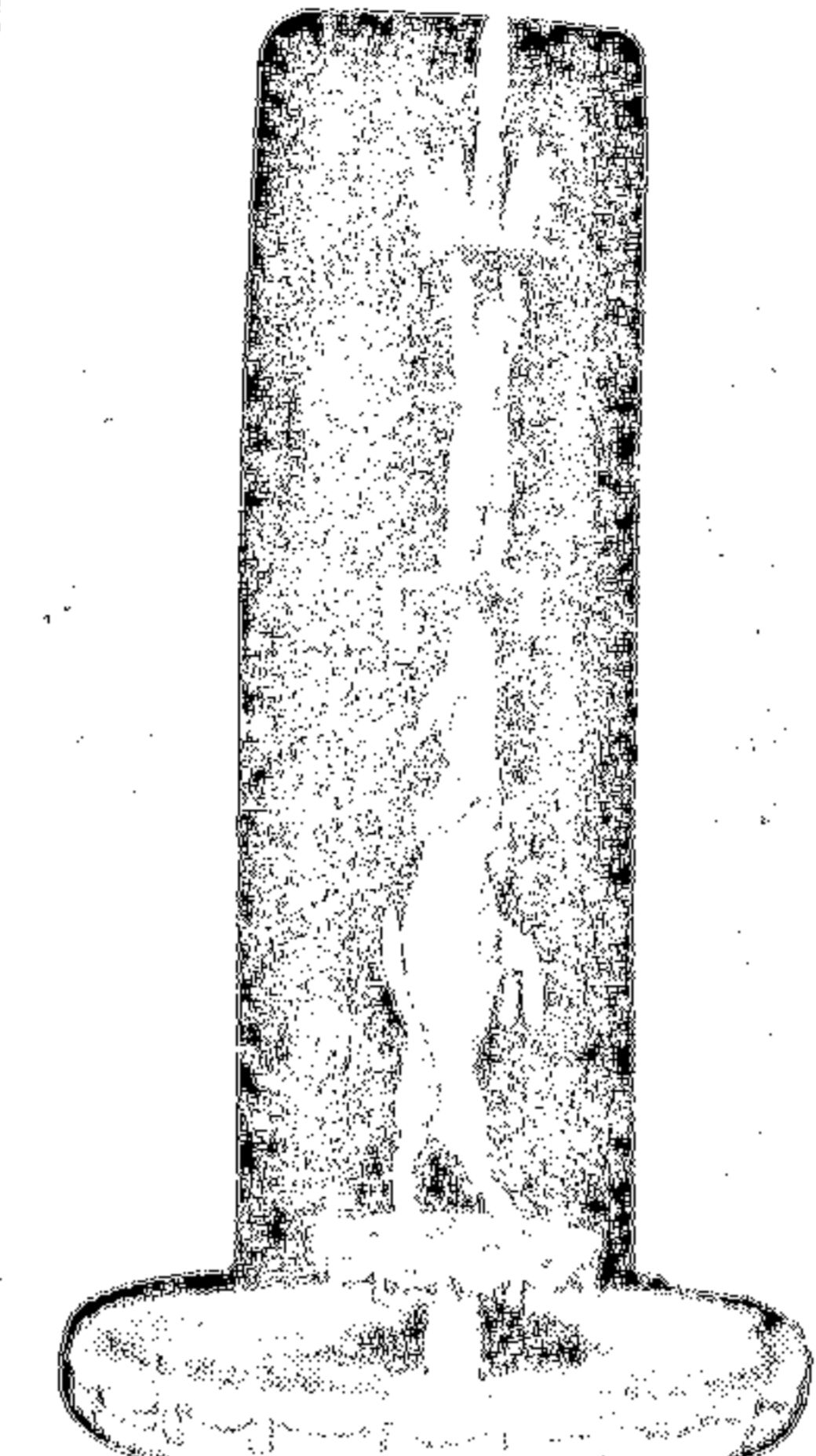
Проект фонтана худ. А. Тышнера для оформления на Триумфальной площади