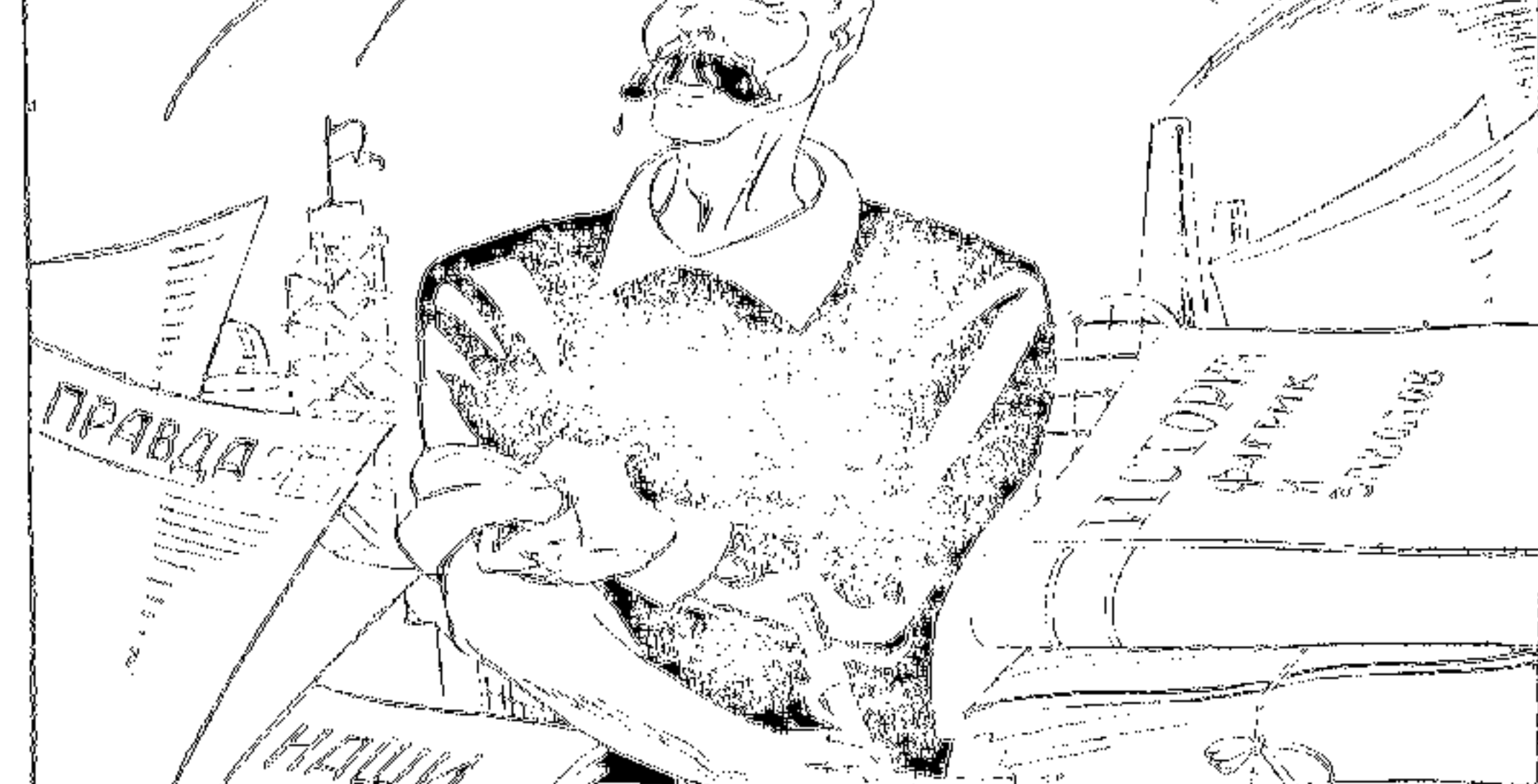
Пожилый человек XX века...