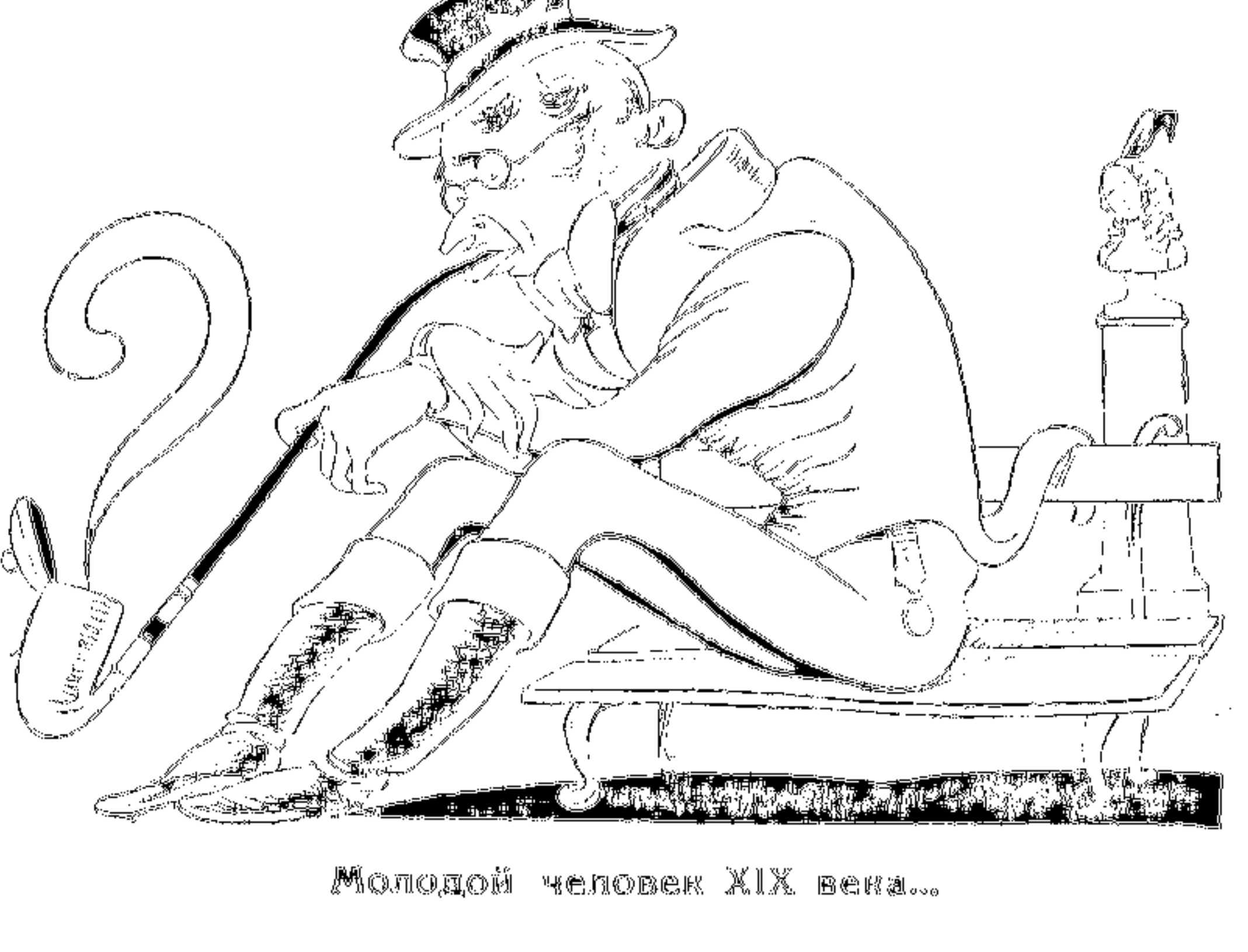
Молодой человек XIX века...