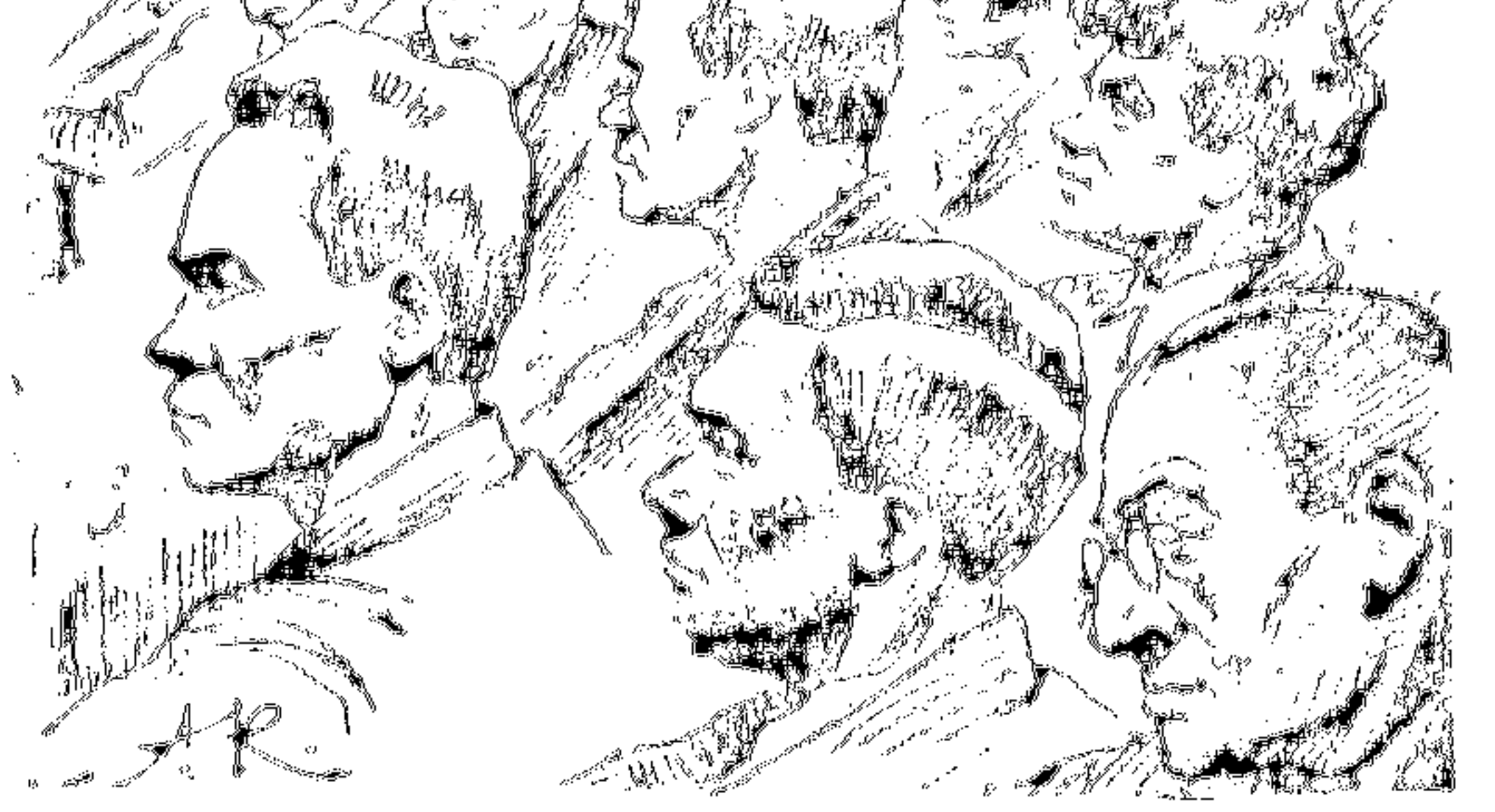
Рис. А. Костомарова