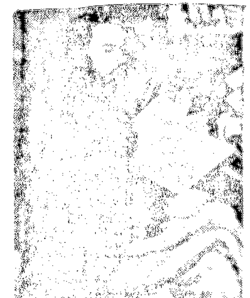
Золя Золя (1858) Портрет худ. За Мань