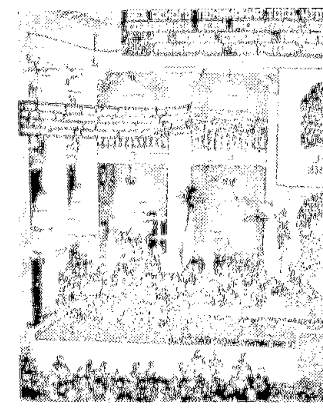
Вечер памяти Гете в Колонийском зале Дома союзов

Дитя, и муж, и старец пусть видит, Что в ушедшей в обласк силы дню...»