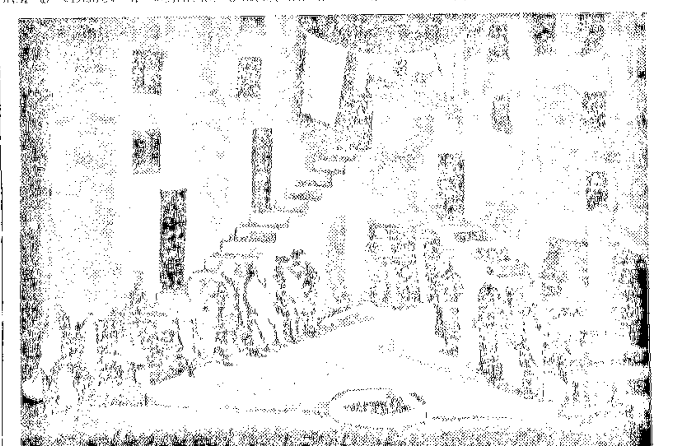
„Улица радости“ в театре Революции. 2 акт