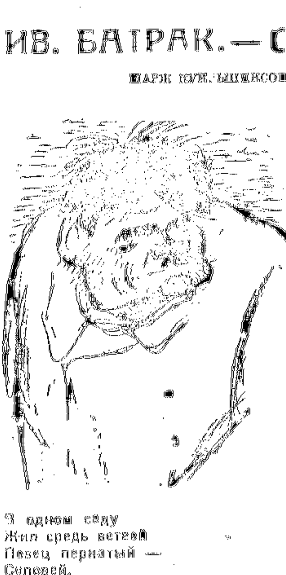
В одном часу Липа среди ветвей Песнь первенный — Соловей.