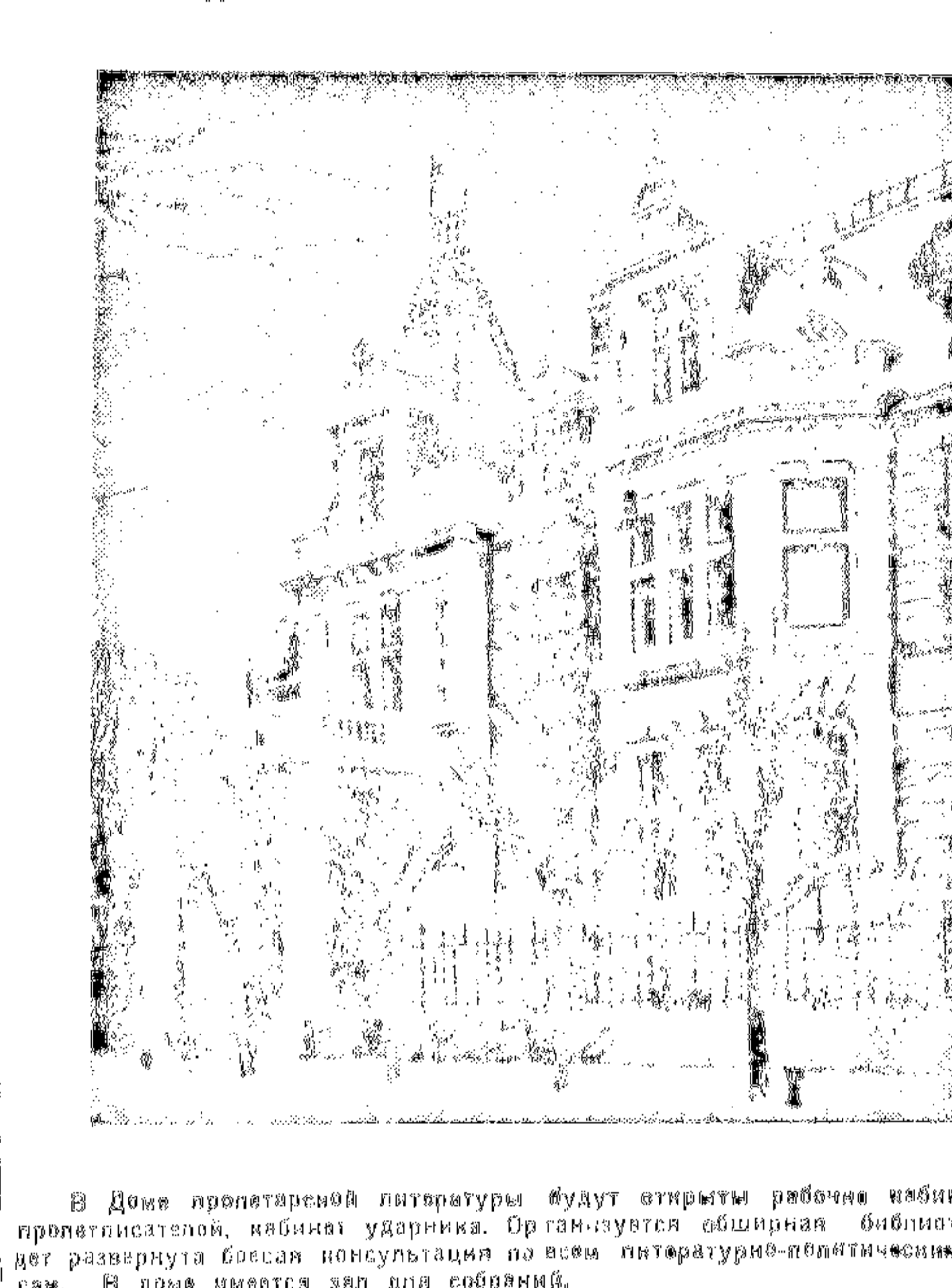
В Доме пролетарской литературы будут открыты рабочие кабинеты для протестантов...