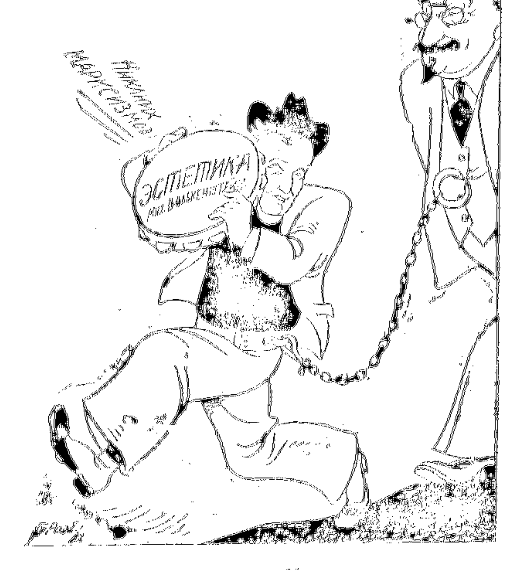
Рис. Гр. РОЗЕ