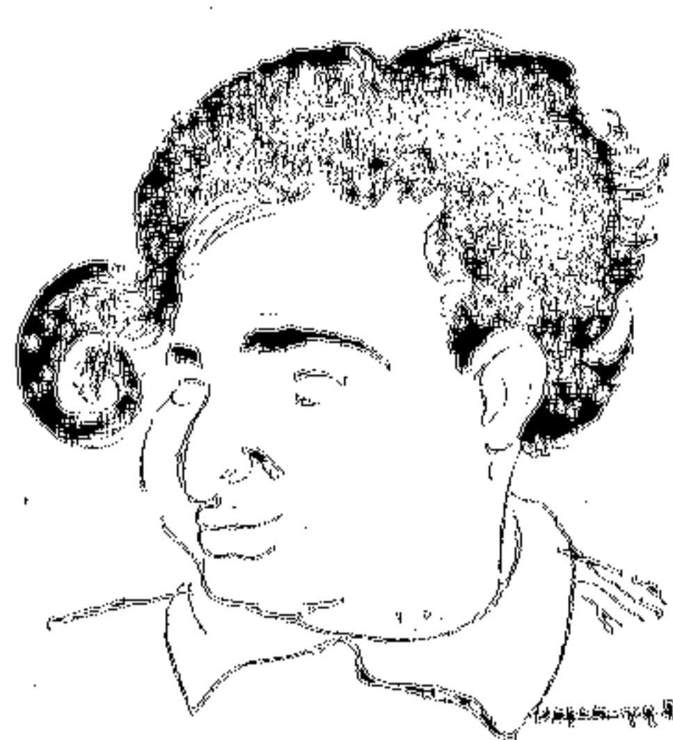
Вобщем ударник! Моей поэзии Дружок зам!