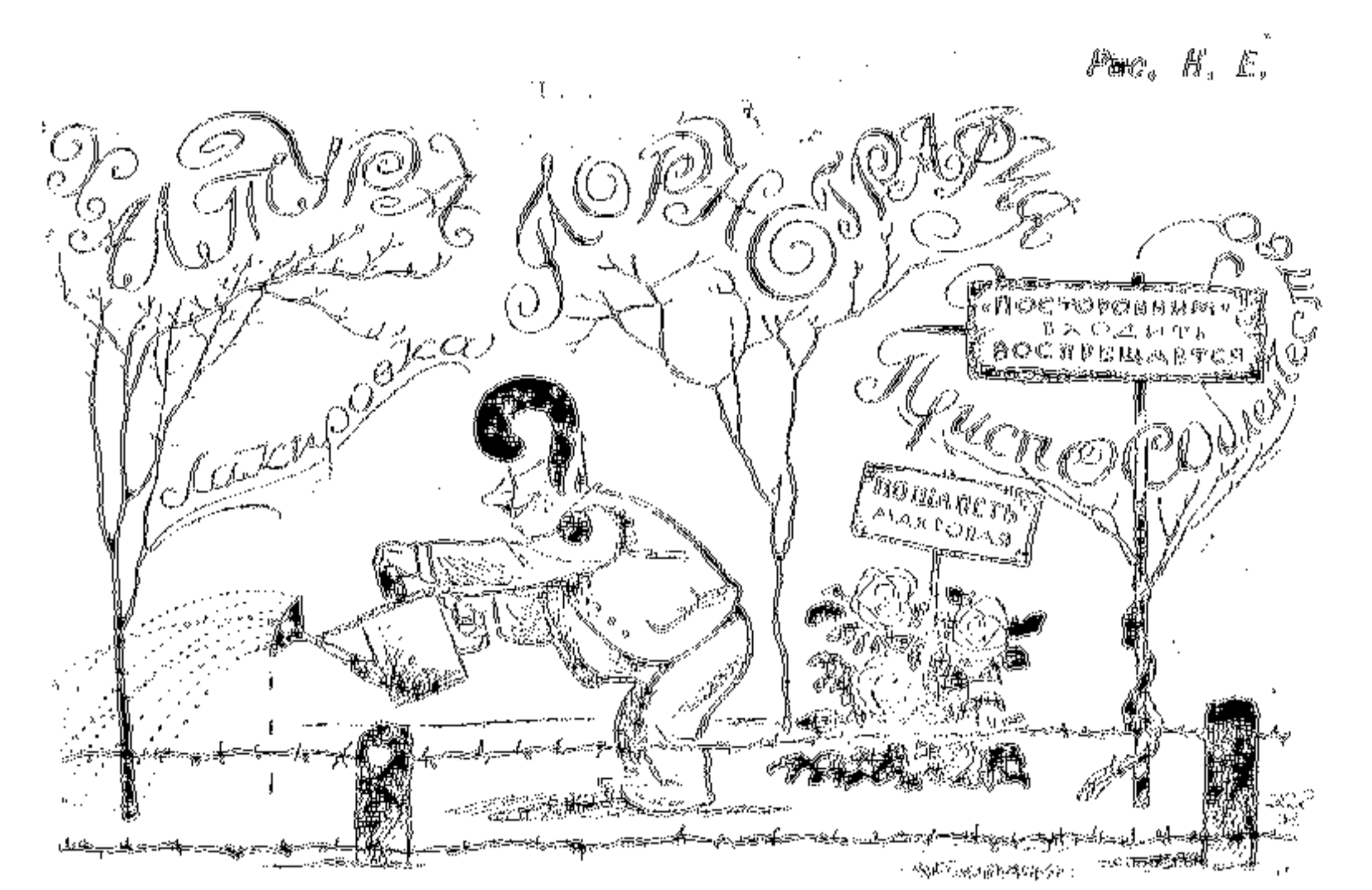
По садам ГИХЛ и Тиражно-печати

В связи с тем, что ликвидация архаизма является задачей не только редактора, но и автора, редакция литературы и т. д.