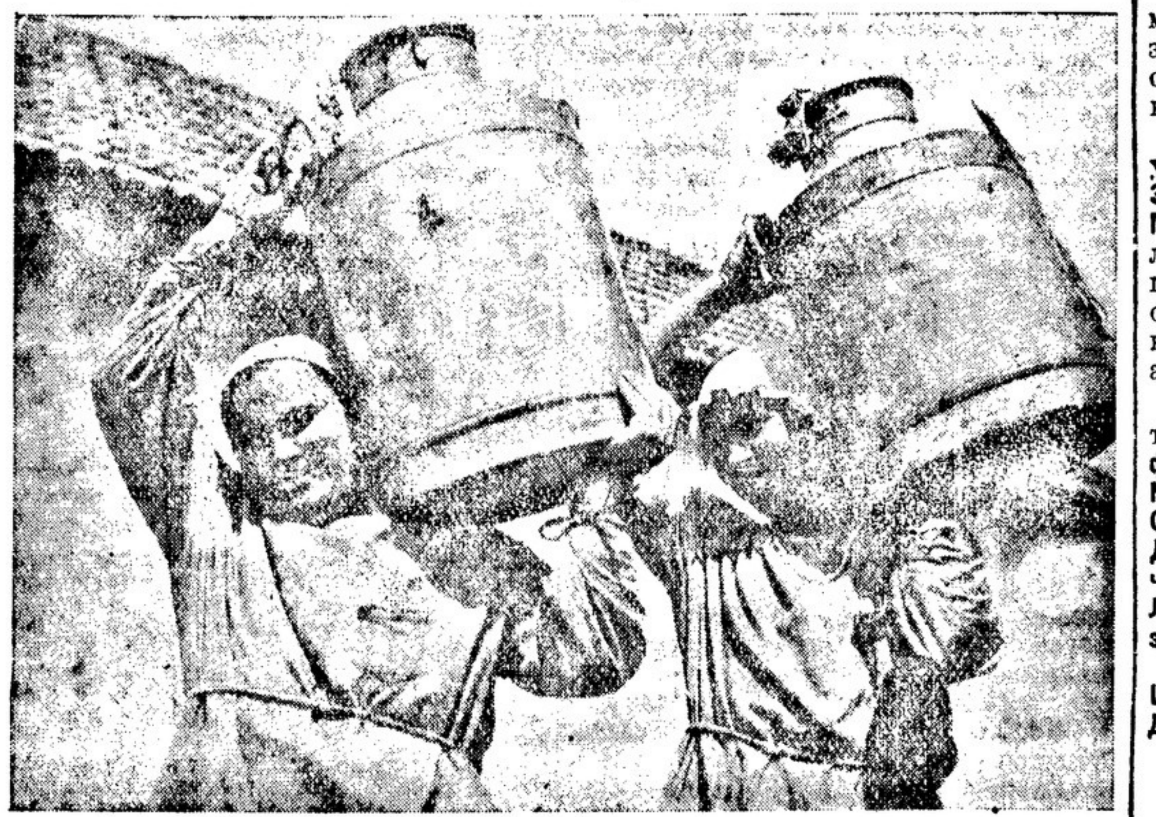
УДАРНИЦЫ КРЫМСКОГО КОЛХОЗА

пом провести уборочную кампанию, провести учет и распределение рабочей силы, путем социализации рабочей дисциплины коммунаров, выполнить 100 процентов заданий по хлебопашению и животноводству, полностью ликвидировать неграмотность и широко развернуть выдвигание коммунаров на руководящую работу. Эти два документа являются чрезвычайно важными. Назначение крестьянских писателей должно найти широчайший отклик среди писательской и советской общественности.