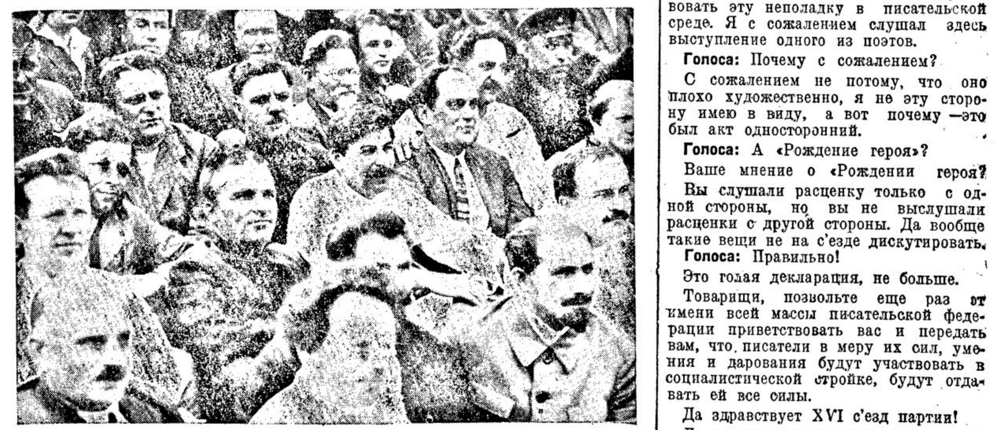
ТТ. СТАЛИН, МОЛОТОВ; КАГАНОВИЧ; КАЛИНИН; ВОРОШИЛОВ; ОРДЖОНИКИДЗЕ, КУЙБЫШЕВ СРЕДИ НИЖЕГОРОДСКИХ ДЕЛЕГАТОВ XVI ПАРТСЪЕЗДА

Председатель оргбюро библиотечного съезда Н. И. Крупская.