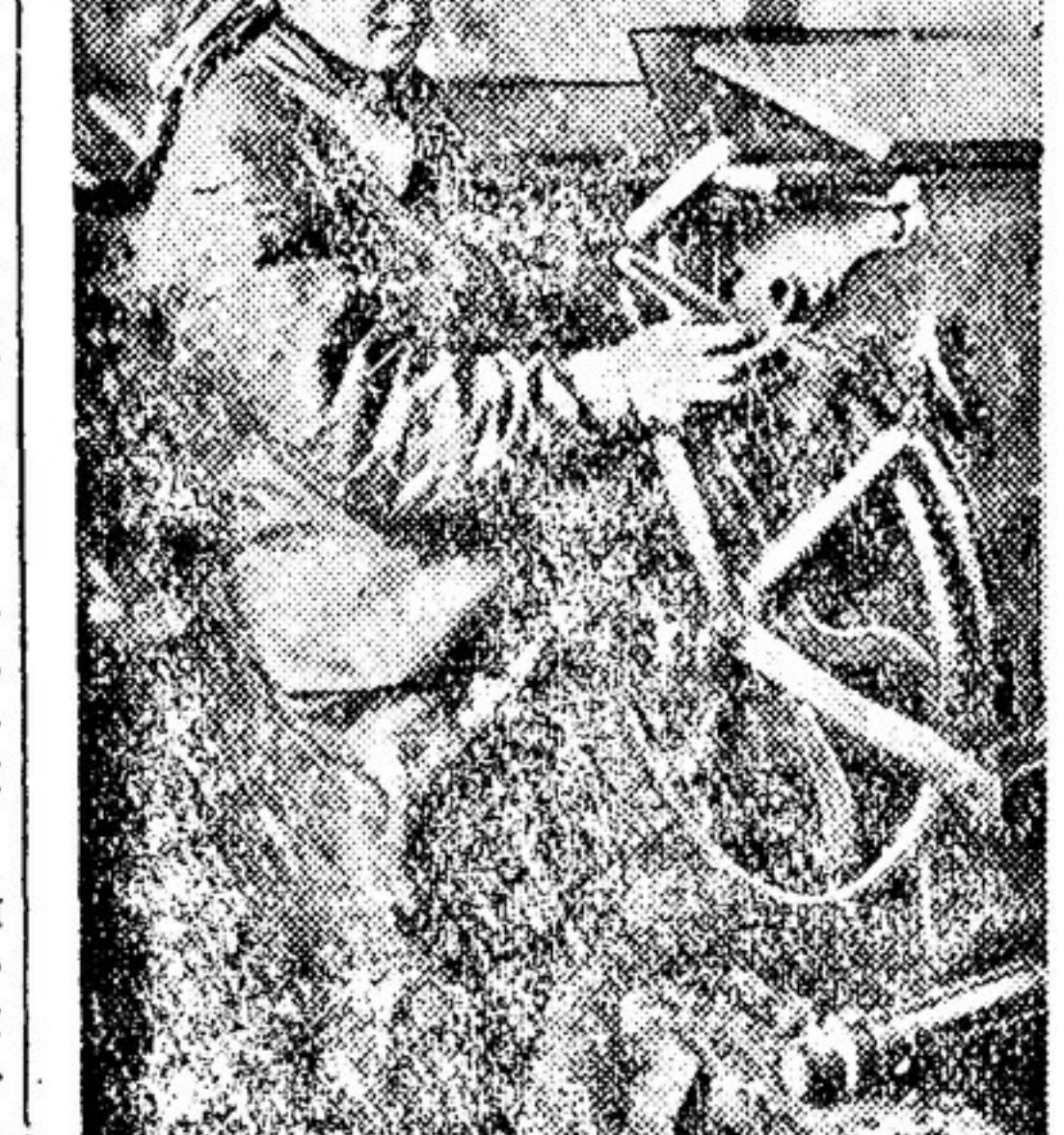
Ударница завода «Красный пахарь»