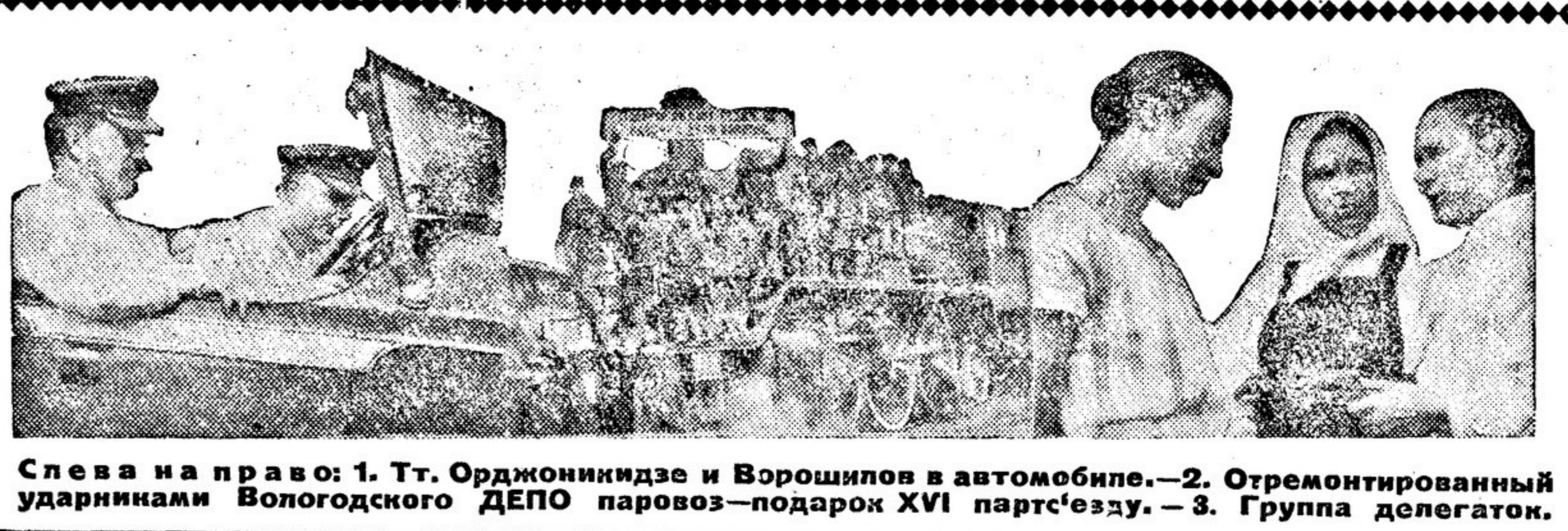
Слева направо: 1. Т. Тр. Орджоникидзе и Ворошилов в автомобиле. — 2. Отремонтированный ударниками Вологодского ДЕПО паровоз-подарок XVI партсъезду. — 3. Группа делегатов.