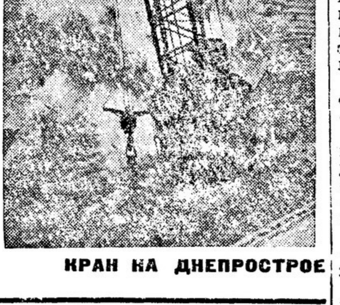
КРАН НА ДНЕПРОСТРОЕ

Один из излюбленных «болотов» методов действия — вести научную работу так, чтобы получился максимальный отрыв науки от масс, от требовавшийся социалистического строительства.