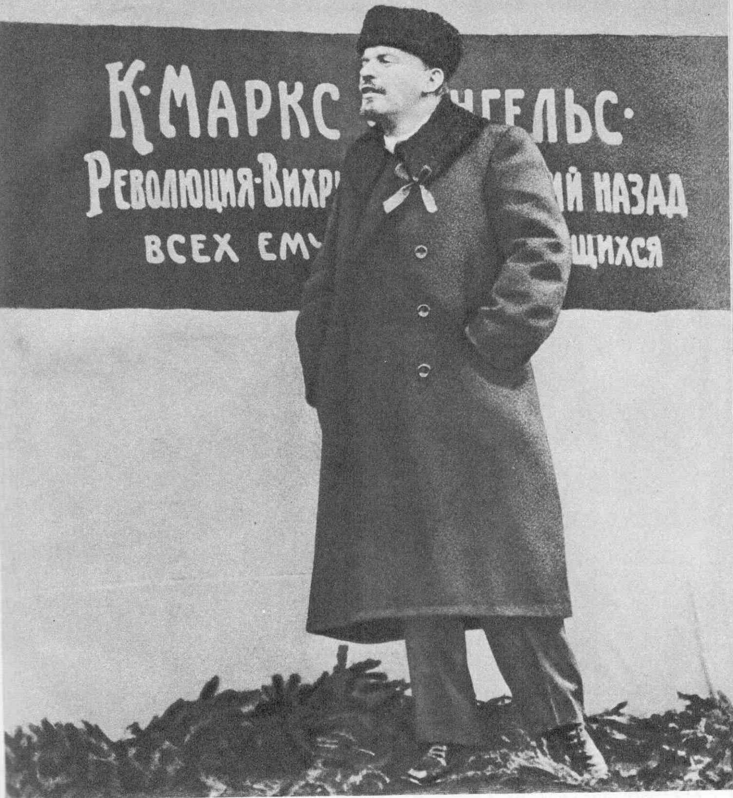
Т А Б Л И Ц А 1. Москва. 7 ноября 1918 г. Выступление В. И. Ленина на открытии временного памятника К. Марксу и Ф. Энгельсу.