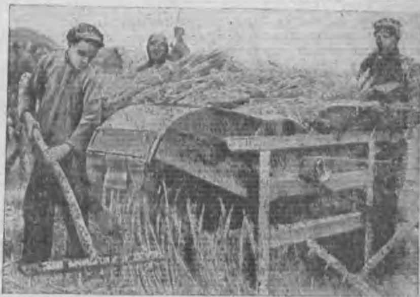
Первый обмолот хлеба нового урожая в колхозе «Волна революции» Карабулакского района Нижней Волги

Своевременная проверка и оформление обязательств по договорам контрактации — необходимое условие правильного планирования. Четкая проверка выполнения обязательств по договорам контрактации обеспечит точное установ-