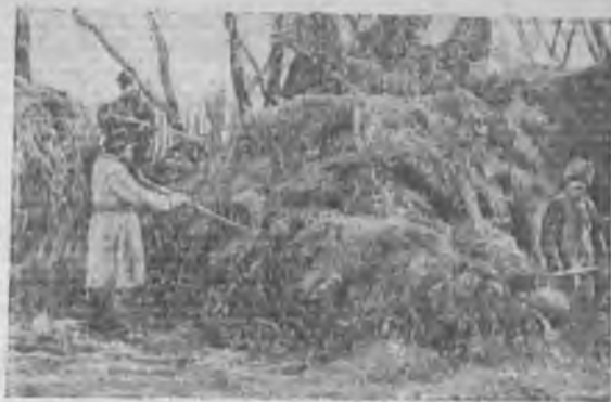
Ударники колхоза «Красный Профинтерн», Брянского района Западной области, свозят сено в общественный сарай для обеспечения тяговой силы кормами.

В Березовском районе развернута проверка контрактационных договоров. По многим колхозам выявлен пересев по