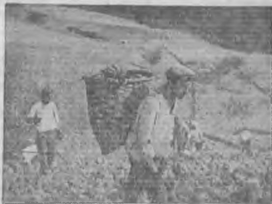
Посадка табака в колхозе «Красный семеновод» Сочинского района Сев. Кавказа

Надо не упускать из вида, что есть промышленность, заинтересованная в зерне со строго определенными показателями качества. Так, например, макаронные фабрики не могут работать на зерне с низким содержанием клейковины. Отсюда ясно, что складирование необходимо довести до совершенства, памятуя, что понижение природных достоинств зерна на складах заготовителя и неумение использовать достижения, уже полученные производителем, есть прямое преступление.