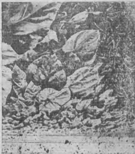
Всходы подсолнуха раннего сева в совхозе «Викторполь», ЦЧО

Некоторое понижение процента заготовок из валового сбора подсолнуха