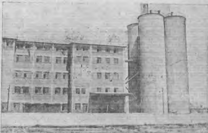
Ашхабадский элеватор, построенный в 1931 г.

Достижения прошлого года по сокращению глубинок и глубинных заготовок, а следовательно по увеличению мобильности государственных хлебных ресурсов, не только должны быть закреплены, но и расширены.