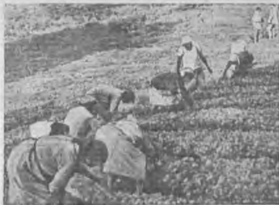
Сборка табачной рассады для высадки на плантации в колхозе им. Фабрициуса Сочинского района Сев. Кавказа

Даже и не особенно высоко квалифицированному хлебнику совершенно ясно, что если промышленность, будь то мельница, макаронный завод или другое предприятие, для которого сырьем является зерно или мука, будет систематически снабжаться однородным зерном, точно определяемыми типом и под-типом ОСТ'а, — это предприятие будет