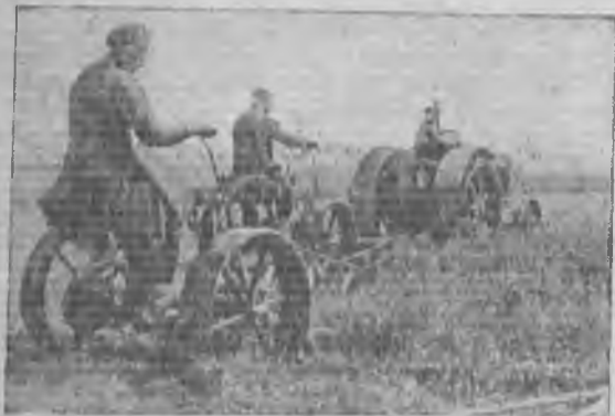
Работа тракторных сенокосилок в Мечетинском совхозе «Овцевод» № 5, Сев. Кавказ

На Северном Кавказе потери во время уборки подсолнуха (осыпание на корню вследствие перестоя, осыпание во время лежания в валках, гниение от дождя, прорастание и т. п.) определяют местными агрономическими силами до 25%, по клещевине до 40%, по сое — в 20—30%.