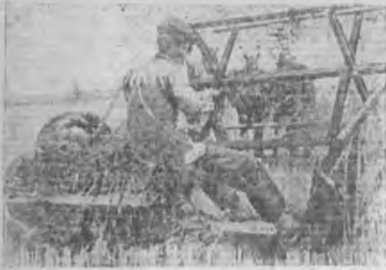
Уборка зерновых посевов колхозами Б. Карабулакского района Нижней Волги

ление действительных посевных площадей, выяснение состояния урожайности, изучение хозяйственного состояния колхозов. При правильном установлении районных и поселенных планов, при правильном внесении обязательств по договорам контрактации в контрактационные книжки количество хлеба, подлежащее к поступлению по этим договорам, должно по размерам совпадать с установленным планом хлебозаготовок по этим секторам.