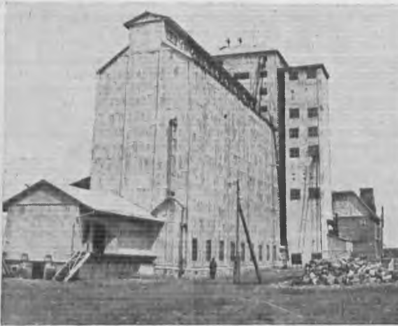
Общий вид Тираспольского элеватора В/О Заготзерно

Машины элеватора: дизель Харьковского завода системы Зульцера в 150 лошадиных сил, 2 нефтемотора по 20 сил и один электро-генератор на 100 квт. Сепаратор элеватора пропускает 120 тонн зерна в час.