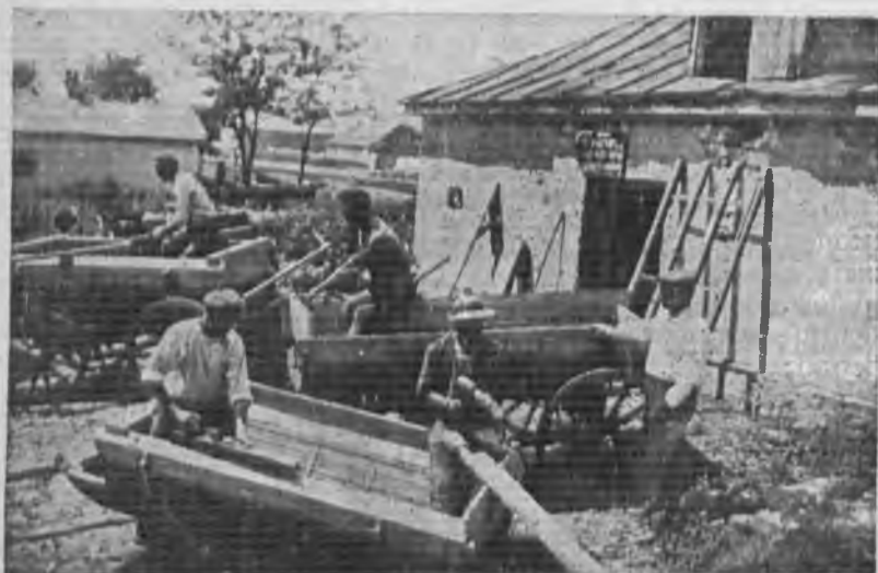
Изготовление повозок для бестарной подвозки зерна в колхозе «Победа» № 2 Матвеево К. рганского района Сев. Кавказа

Только при такой четкой, организованной, боевыми темпами проводящейся работе МТС смогут справиться с громадной задачей, возложенной на них партией и правительством.