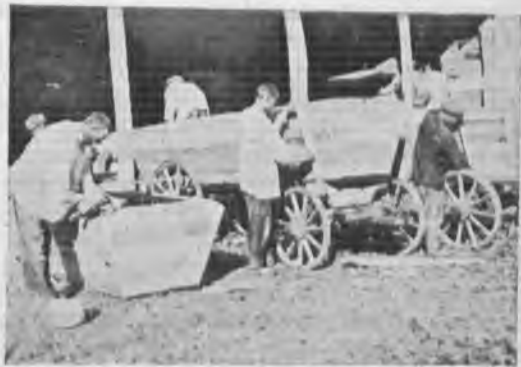
Изготовление ящиков-повозок для bestарной перевозки зерна в колхозе „12-й Октябрь“, Ново-Александровского района Сев. Кавказа.

Специфические особенности работы по операциям с объемфуражем, задачи организации сеного рынка, развитие технической базы, проведение в широких размерах складского строительства, подготовка специальных кадров и т. д.— настоятельно требуют безотлагательной реализации постановления СТО от 16/IV, по которому Заготсено является самостоятельной хозяйственной организацией внутри В/О Заготзерно, на правах треста, и перевода Заготсено на самостоятельный баланс, как в центре, так и на местах (аналогично существующему внутри Заготзерно объединению по мукомолью «ВОМКО»).