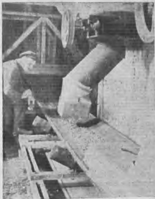
Подача зерна из силосов в сушилку на Тираспольском элеваторе.

Ряд контор плохо организовал бытовое обслуживание курсантов, вследствие чего имел место отсев курсантов и даже сами курсы были поставлены под угрозу срыва (Оренбург — курсы хлебных контролеров; Петропавловск — счетные курсы; слабо поставлена педагогическая подготовка в Ачинске на курсах зав. элеваторами; Сев. Кавказская контора неправильно установила систему оплаты содержания курсантов).