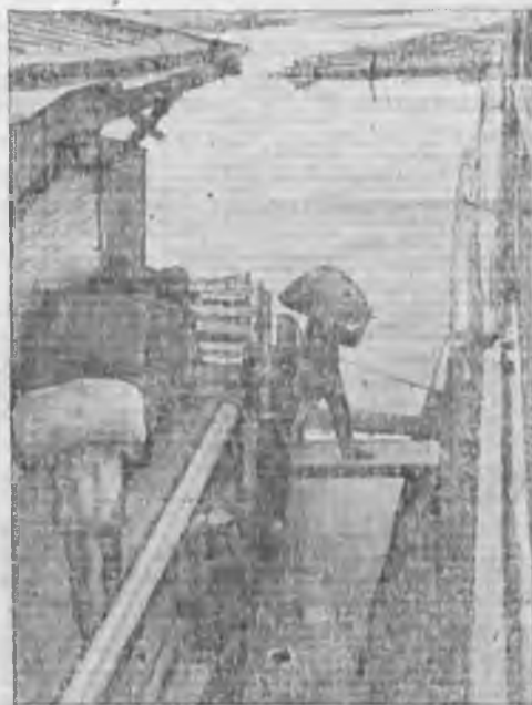
Погрузка хлеба на пароход в г. Маркштадте (АССР НП).

Такое качество сырья фактически снижает ответственность администрации и технического персонала предприятий за выхода и качество продукции, ибо действительно трудно из затхлого, тухлого и синего ячменя сделать доброкачественную продукцию.