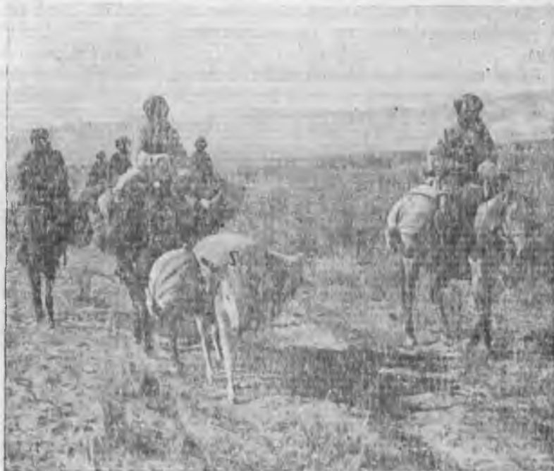
Хлопок колхоза «Нарын-Ломай» (Таджикистан) на пути к приемочному пункту

Хозяйственная целесообразность и успешная работа организованных тремя колхозами Маргеланского района постов по борьбе с потерями