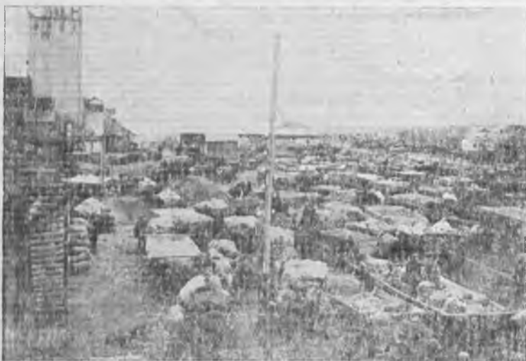
Колхозники сдают кукурузу на Матвеево-Курганском элеваторе (Сев. Кавказ)

Этот саботаж хлебозаготовок возглавляется стансоветом. Председателя Стансовета Склир заявил на прези-