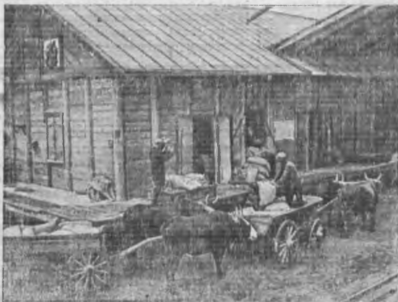
Совхоз «Пионер» (Камышинский р-н Н. Волжского края) сдает пшеницу на Камышинский элеватор.

Районы, расположенные вокруг промышленных центров и городов, будут закреплены за последними для снабжения их цельным молоком. База цельномолочного снабжения по сравнению с 1932 г. значительно расширяется. Заготовители цельного молока — потреби-