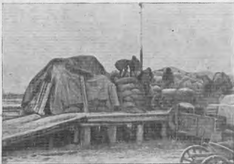
Сдача хлеба коммуна «Красный маяк» (Сухо-ложье, Урал) на Богдановичский ссыпункт.

По данным Заготзерно к 5 декабря план по подсолнуху был выполнен всего на 27,6%. Колхозы план по подсолнуху в этом году выполнили