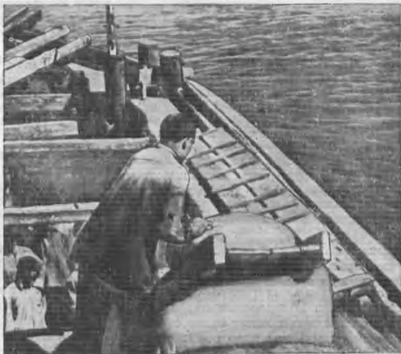
Погрузка муки в Саратове (Н. Волга)

Славная победа колхозников на хлебном фронте достигнута в результате жесточайшей борьбы с остатками кулаче-