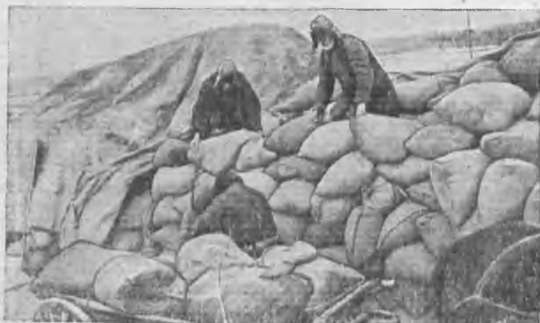
Сдача хлеба коммуна «Красный маяк» на Богдановическом сыпункте Заготзерно (Сухоложье, Урал)

Все эти потери в производстве вызваны отсутствием наблюдения за поставкой промышленного сырья не толь-