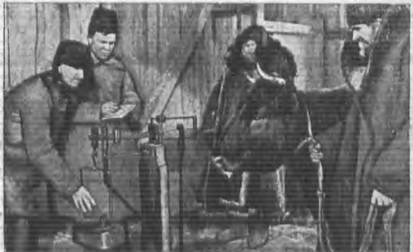
Взвешивание коровы на Солнечногорском райзаготпункте (Моск. обл.) — корову сдают колхозники деревни Танковка.

6. Предложить СНК республик, край-вым и областным исполкомам, крайкомам, обкомам и ЦК нацкомпартий в со-