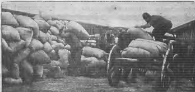
Сдача хлеба колхозом им. Рыкова Сталинград- ского района, Н. Волга.

Мы потому так уверенно можем это сказать, что у нас под ногами имеется уже прочная материальная база в народном хозяйстве и, прежде всего, в развернувшейся за последние годы промышленности.