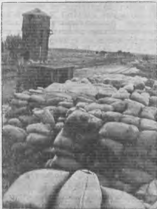
Штабеля мешков с зерном под открытым небом на ст. Котлубань Юго-Вост. ж. д. (Н. Волжский кр.) в ожидании погрузки.

Прежде всего они характеризуют качество руководящей работы по хлебозаготовкам. Такое положение возможно тогда, когда силы не сосредоточены на решающих, узловых участках, когда нет достаточного оперативного руководства районом, селом и колхозом, когда вме-