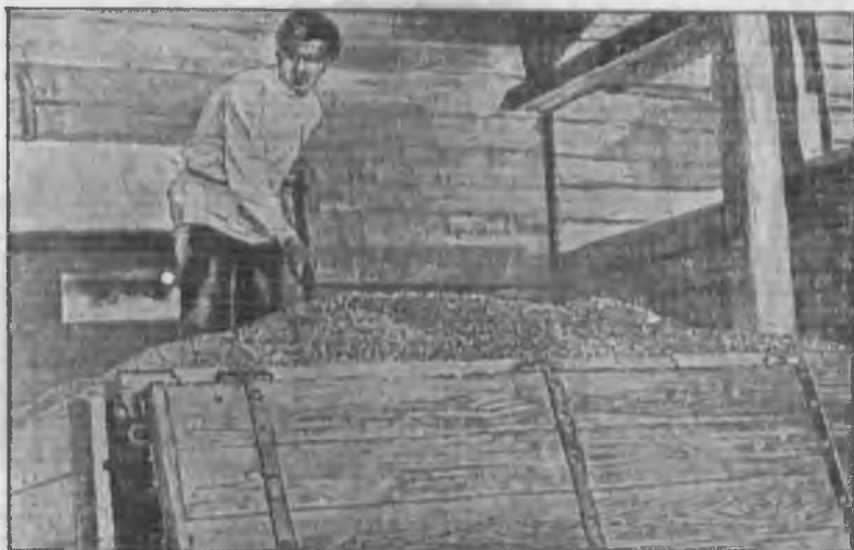
Ссыпка подсолнуха, поступившего из Расшеватского зерносовхоза (ст. Расшеватка - Сев. Кавказ, элеватор Заготзерно)

На практике приходится сталкиваться с таким явлением: вывозя хлеб на заготовительный пункт, кулак скрывает характер этого хлеба и сдает его, как контрактанный хлеб. Такого рода махинации, путающие все данные о поступлении хлеба по твердым заданиям, могут иметь место только при наличии халатного отношения работников заготпунктов к заготовке кулацкого хле-