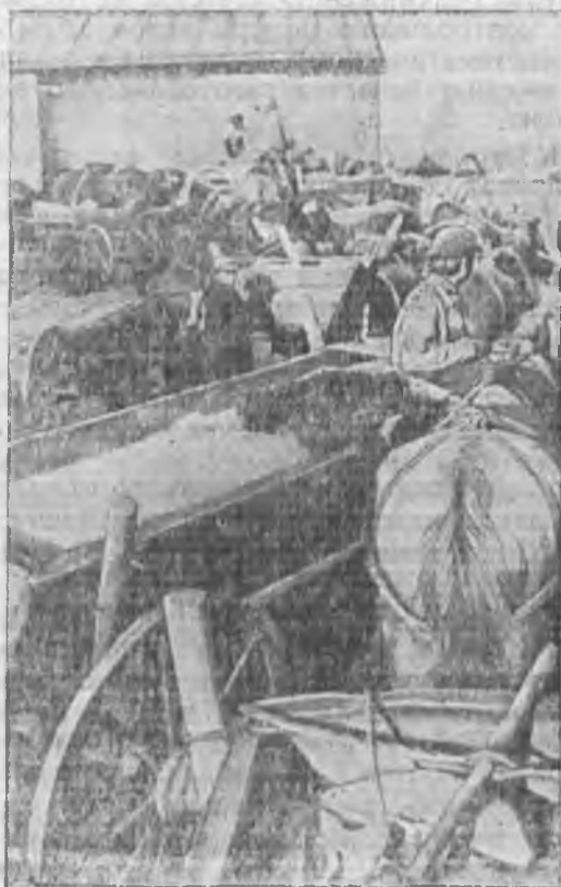
Бестарый обоз с пшеницей колхоза «Верный путь» у сыпного пункта, Белевский р-н, Зап. Сибирь

Одной из наиболее важных причин неудовлетворительного хода хлебозаготовок в индивидуальном секторе является недооценка в практике