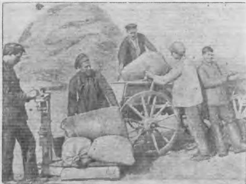
Краснознаменная бригада № 7 колхоза Ворошиловец (Нижне-Волжский край) отправляет пшеницу на элеватор.