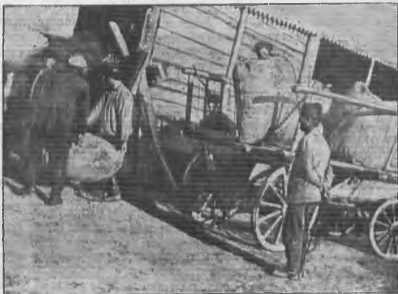
Сдача хлопка колхозом им. Молотова на ст. Карамык (Сев. Кавказ)