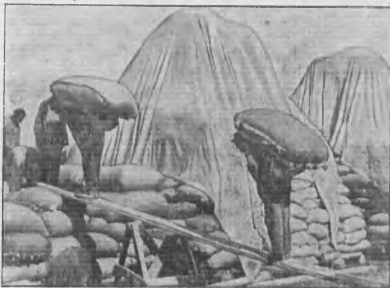
Укладка нового хлопка на Геокчайском сккупункте, Азербайджан

Во многих селах кулака потеряли. А районные работники, вместо выявления