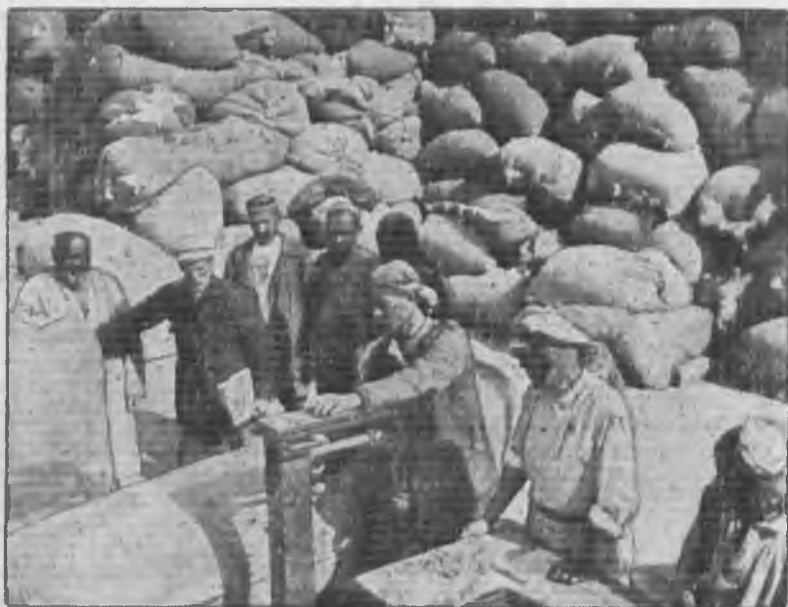
Колхозники 2-й бригады колхоза им. Сталина (Янги-Юль, Узбекистан) сдают хлопок на скуппункт № 4.