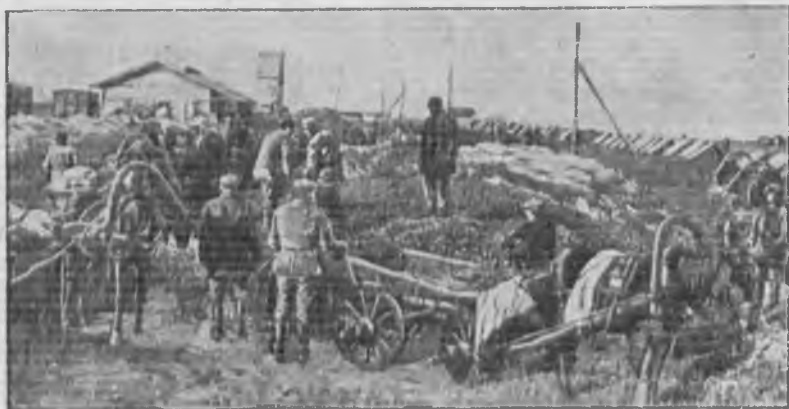
Красный обоз ссыпает для эшелона картофель на ст. Куликово поле (Куркинский р-н Моск. обл.) для отправки в Москву.

Вопросами подготовки кадров для колхозной торговли потребительской кооперации почти не занималась Чувашисоюз в этом отношении ничего низовке не дал. Общего планового руководства работой си-