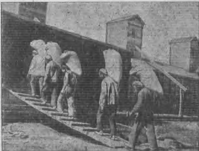
Ссыпка хлеба на элеватор ст. Филоново (Н. Волжск. край)

Условия заготовительной работы этого года в многом разнятся от условий