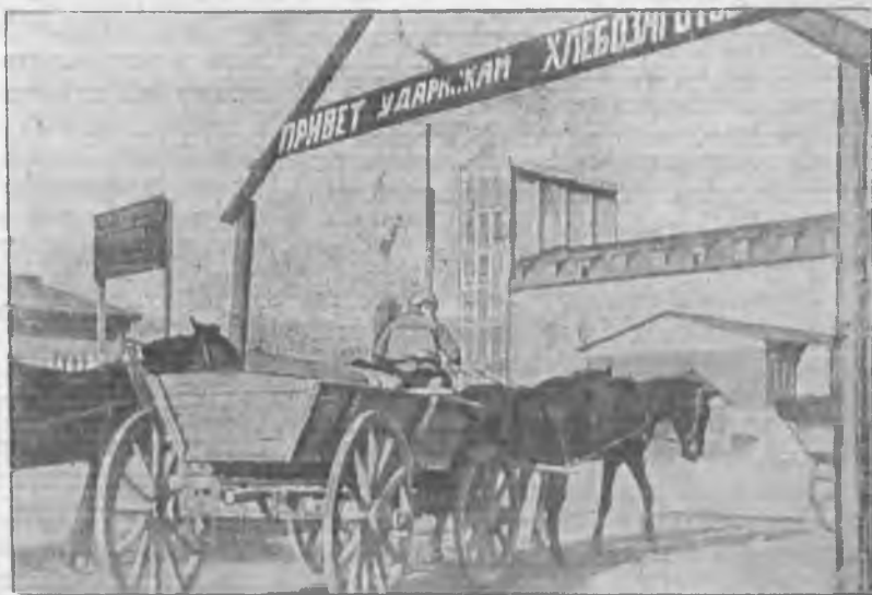
Элеватор при ст. Филоново (Н. - Волжский край)