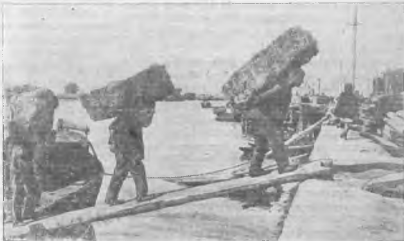
Разгрузка барж с сеном в Херсонском порту (УССР)

Другим недостатком работы системы Заготзерно является то, что она плохо удерживает подготовленные кадры. В аппарате имеет место чрезвычайно большая текучесть, отчасти обусловленная отсутствием заботы о закреплении постоянного кадра работников, о создании более удовлетворительных материально-бытовых условий для работников пунктов и т. д.