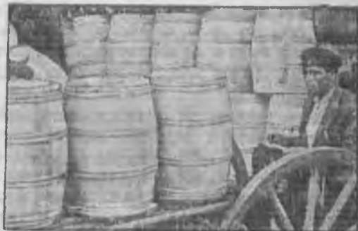
Отправка партии масла с Красноборского маслозавода (Сев. край) закрытым рабочим кооперативам промышленных центров

В текущем году на долю IV квартала падает 27,2% годового плана. При громадном увеличении удельного веса социалистического сектора (по системе Союзмаслопрома по плану — 73,8%, а в фактических заготовках — 63%), при ослаблении в силу этого влияния сезонности, задача дать в IV квартале 27 — 28% годового плана является выполнимой, хотя и трудной задачей. Она требовала мобилизации всех сил системы, она требовала умения работников системы добиться в сложнейшей осенней обстановке на селе должного внимания к этому виду заготовок со стороны партийных, советских, комсомольских и других организаций, она требовала мобилизации широких масс сдатчиков молока.