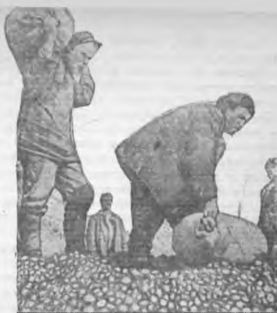
Колхозники колхоза «Новый Урай» Рыбно-слободского района Татар. АССР сдают картофель на сыпной пункт

Плохо подготовились к приему овощей райспазы. Слабо участвует в подготовке хранилищ