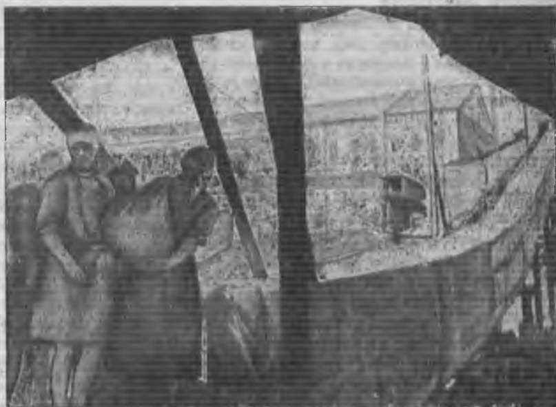
Выгрузка зерна из баржи на конвейер мельницы в Саратове

В связи с этим по всем линиям должен быть усилен контроль как за ценами децентрализованных заготовок, так и реализационными ценами этой продукции. Встречная торговля протомоварами, согласованное выступление заготовителей, временное прекращение децентрализованных заготовок в тех или иных районах, где имеет место спекулятивное повышение рыночных цен,