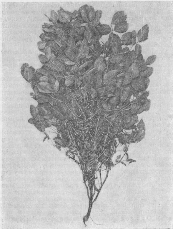
1. Сильно облиственная кормовая форма (Аджаметская опытная станция, Западная Грузия, 1933 г.). Из мировой коллекции сои.