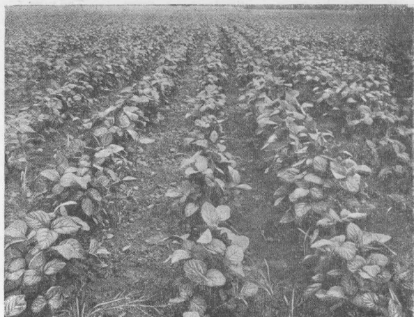
3. Посев сои, букетированный культиватором орловского з-да им. Медведева, 1933 г. Вид вдоль рядков.

Из методов управления развитием растений (помимо яровизации) изучался вопрос химической стимуляции . Лаборатория агрофизиологии бывш. НИИСКА шла в этом вопросе двумя путями: длительным воздействием