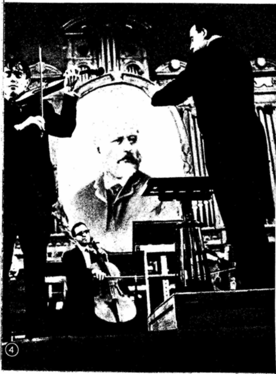
Т А Б Л И Ц А VIII. 1. ФРГ. Реваншистское собрание в Киле. Июнь 1966 г. 2. Новые жилые дома в Улан-Баторе. 3. Нью-Йорк. На открытии нового здания Метрополитен-опера в Линкольн Сентр. 16 сентября 1966 г. 4. III Международный конкурс им. П. И. Чайковского (Москва, 30 мая—29 июня 1966 г.). Выступает советский скрипач Виктор Третьяков (первая премия). 5. Италия. Студенты выносят картины, пострадавшие от наводнения во Флоренции. Ноябрь 1966 г.