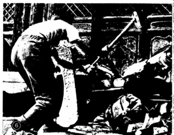
Т А Б Л И Ц А VII. 1. Террор в Индонезии. Один из многих тысяч коммунистов Индонезии, брошенных за решетку. 2. Разгром бесчинствующими антикоммунистами «Университета Коммунистической партии Индонезии» в Джакарте. 3. Испания. Разгон антифранкистской демонстрации в Сан-Себастьяне. 12 июня 1966 г. 4. Южная Родезия. Террористические операции правительства Смита. 1966 г. 5. Из них готовят хунвейбинов. 6. «Культурная революция» в действии. Хунвейбин расправляется с экспонатами музеев.