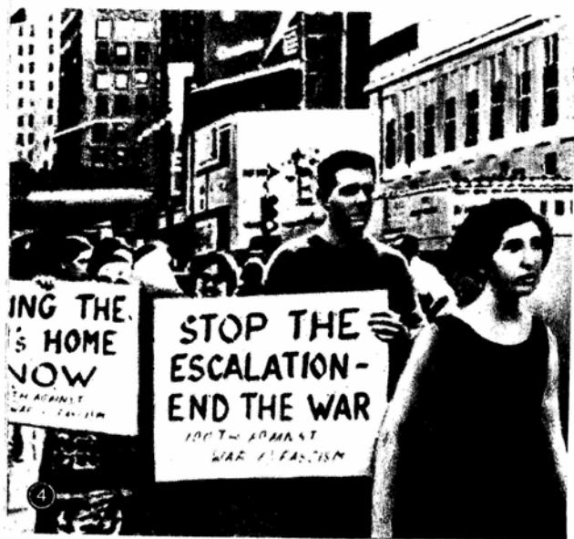
Т А В Л И Ц А VI. 1. Врыв нефтехранилища в окрестностях Ханоя в результате американской бомбардировки. 2. Вьетнамский школьник несет товарища, раненного во время одной из американских бомбардировок. 3. Весь вьетнамский народ поднялся на борьбу с американскими интервентами. 4. Нью-Йорк. Демонстрация протеста против поворота войны во Вьетнаме. 6 августа 1966 г. 5. Лондон. Полиция преграждает путь к посольству США демонстрации протеста против американских бомбардировок Ханоя и Хайфона. 3 июля 1966 г.