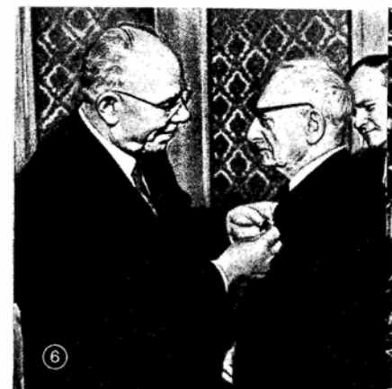
Т А Б Л И Ц А V. 1. Москвичи приветствуют на аэродроме президента Франции Ш. де Голля, прибывшего с визитом в СССР, 20 июня 1966 г. 2. А. Н. Косыгин и Ш. де Голль во время переговоров в Елисейском дворце, Париж, 1 декабря 1966 г. 3. А. Новотный среди делегатов XIII съезда КП Чехословакии, проходившего в Праге 31 мая — 4 июня 1966 г. 4. Л. И. Брежнев, Я. Кадар, Д. Каллаи отвечают на приветствия делегатов IX съезда Венгерской социалистической рабочей партии, Будапешт, 28 ноября 1966 г. 5. Л. И. Брежнев в президиуме IX съезда Болгарской КП, София, 14 ноября 1966 г. 6. Н. В. Подгорный вручает орден Трудового Красного Знамени президенту общества «Австрия — СССР» проф. Г. Глязеру, Вена, 16 ноября 1966 г.